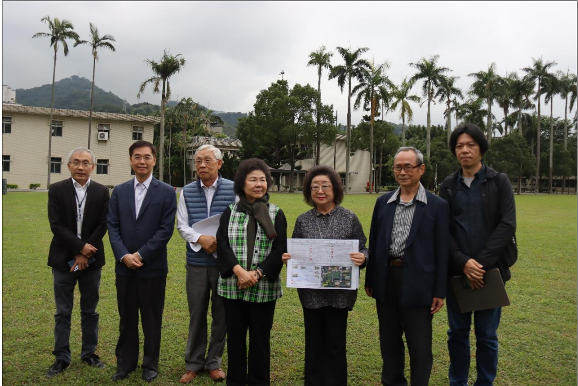
中央運動場和花園現況