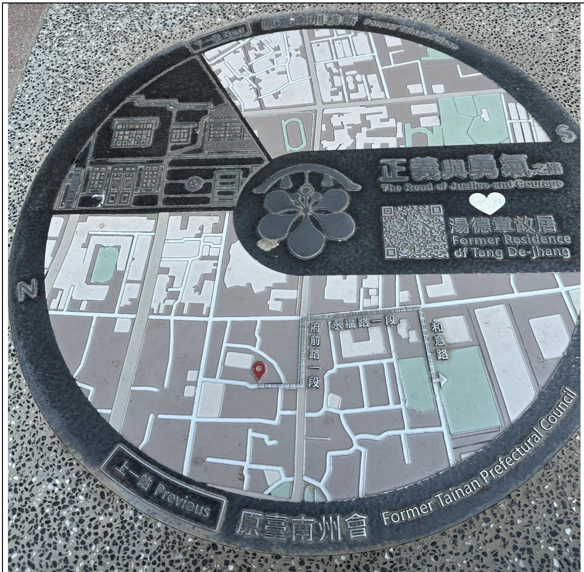
正義與勇氣之路-人行道鋪設之地圖指引