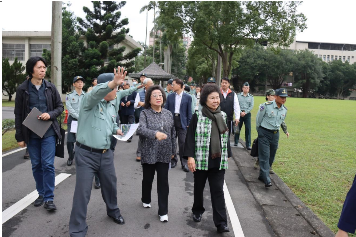
范委員與當年交付感化之當事人比對現況遺址2