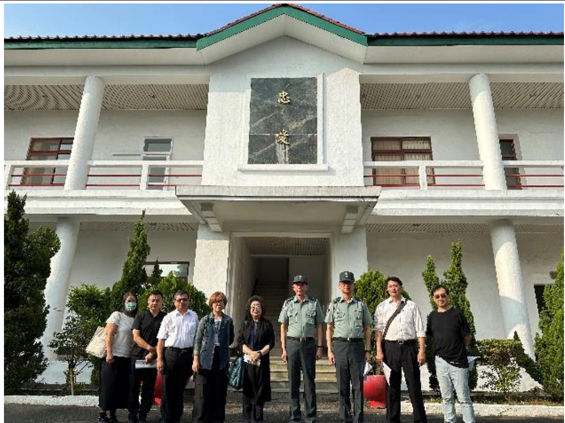
原高雄要塞司令部（228事件不義遺址）