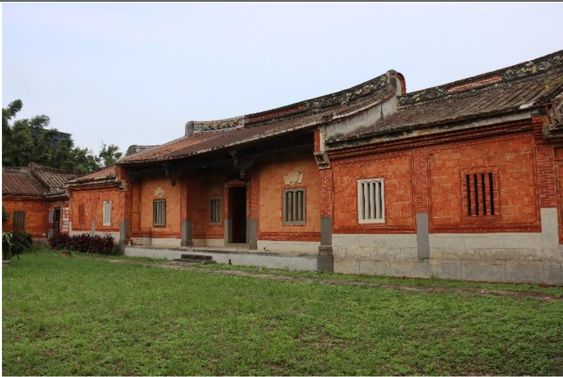
原國防部保密局桃園感訓所（桃園監獄、徐家祠堂、天牢） （潛在白色恐怖不義遺址）