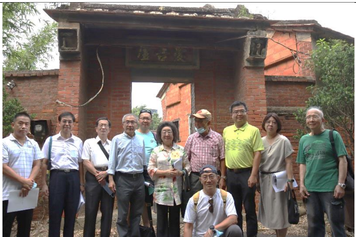
建築（愛吾廬）保留完好屬私人產權，四周布滿竹林