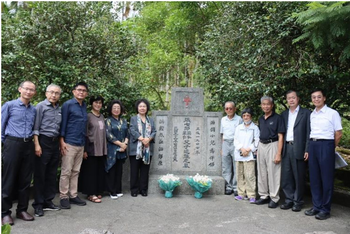
張七郎紀念墓園（太古巢農園）