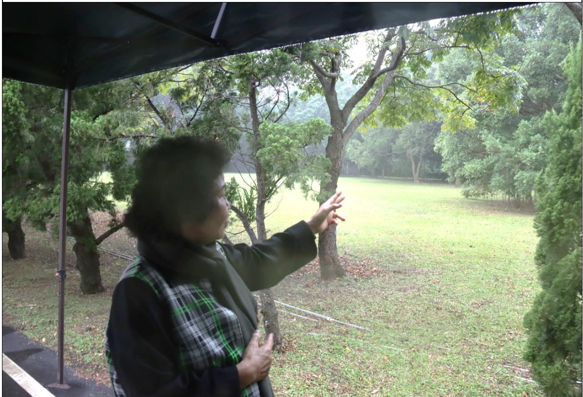
當年女學員區建築物位於營區西南角（現為空地）