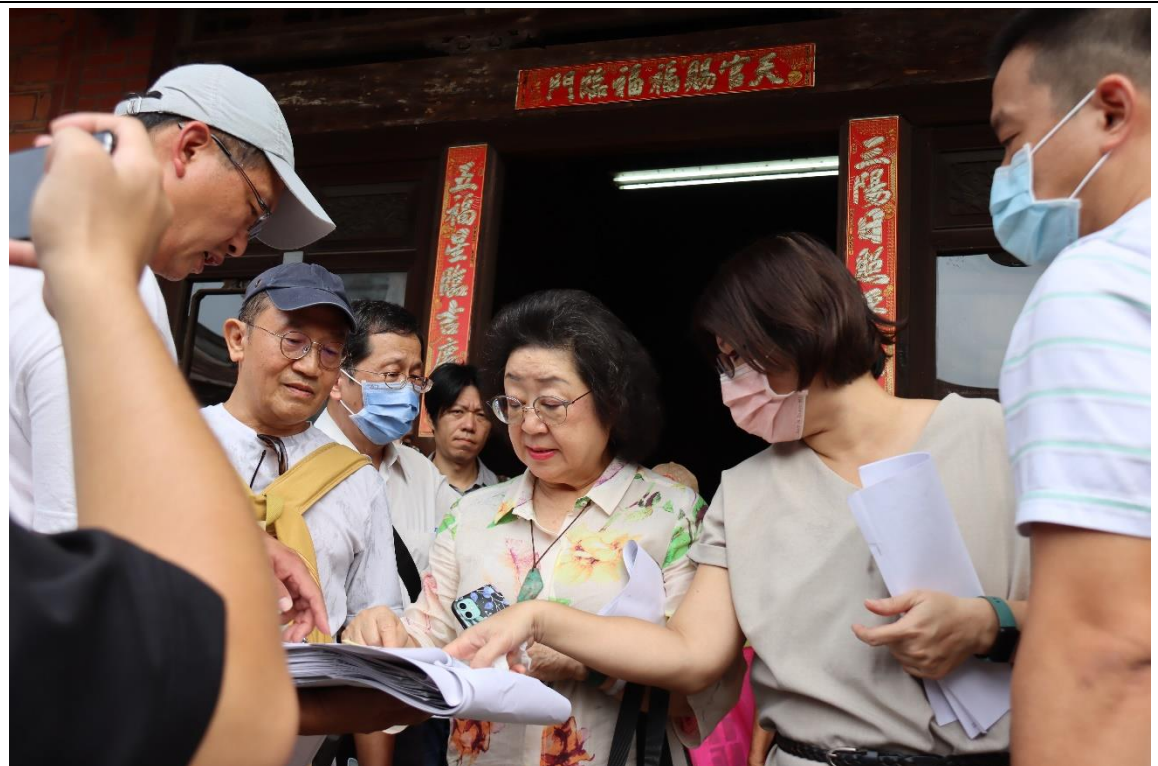
徐氏家屬反應難跟下一代解釋何謂「不義」、「不義」在哪裡、 我家為何被列為「不義遺址」等意見