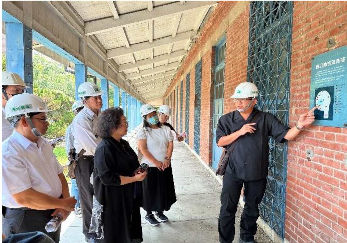
原海軍總司令部情報處拘留所（海軍明德訓練班）