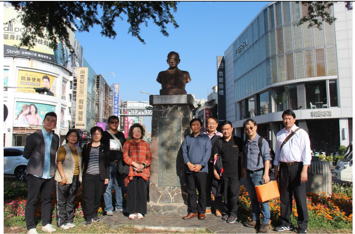
湯德章紀念公園（臺南原民生綠園；審定不義遺址）