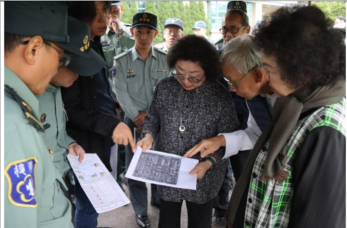
原臺灣省生產教育實驗所（新北市土城區，審定不義遺址） 范委員與當年交付感化之當事人比對現況遺址1