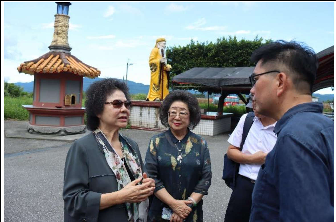
二二八事件不義遺址（花蓮鳳林公墓；張七郎槍殺地點）