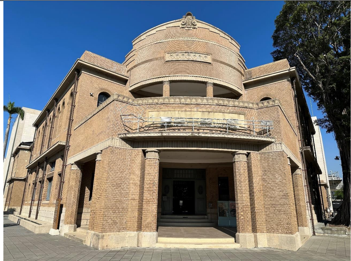
原臺南警察署（現為臺南市美術館一館）大門