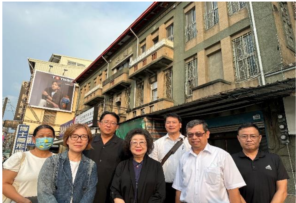
原海軍總司令部情報處拘留所 （私有產權白色恐怖潛在不義遺址）