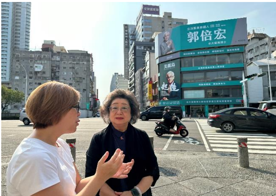
原美麗島雜誌社高雄市服務處 （私有產權白色恐怖潛在不義遺址）