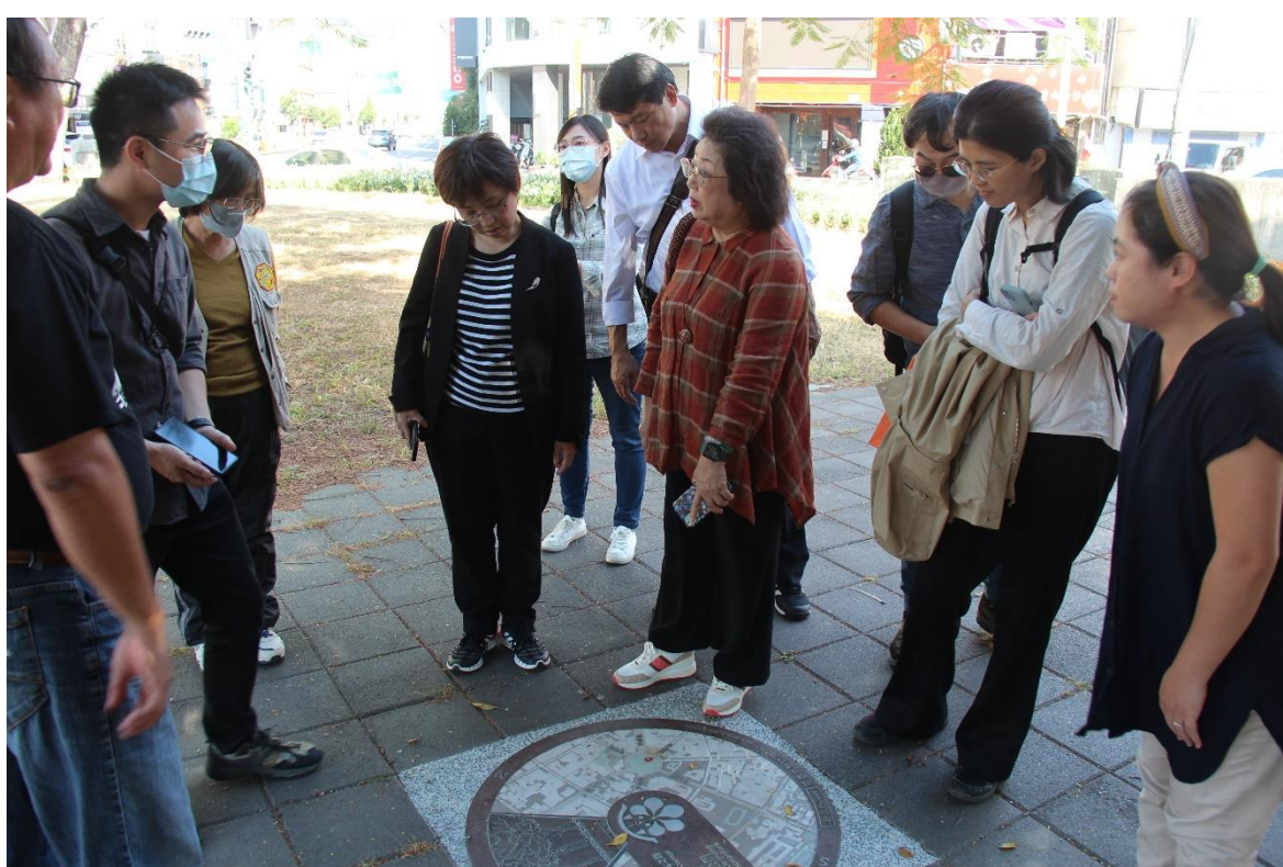
湯德章紀念公園（臺南原民生綠園；審定不義遺址）