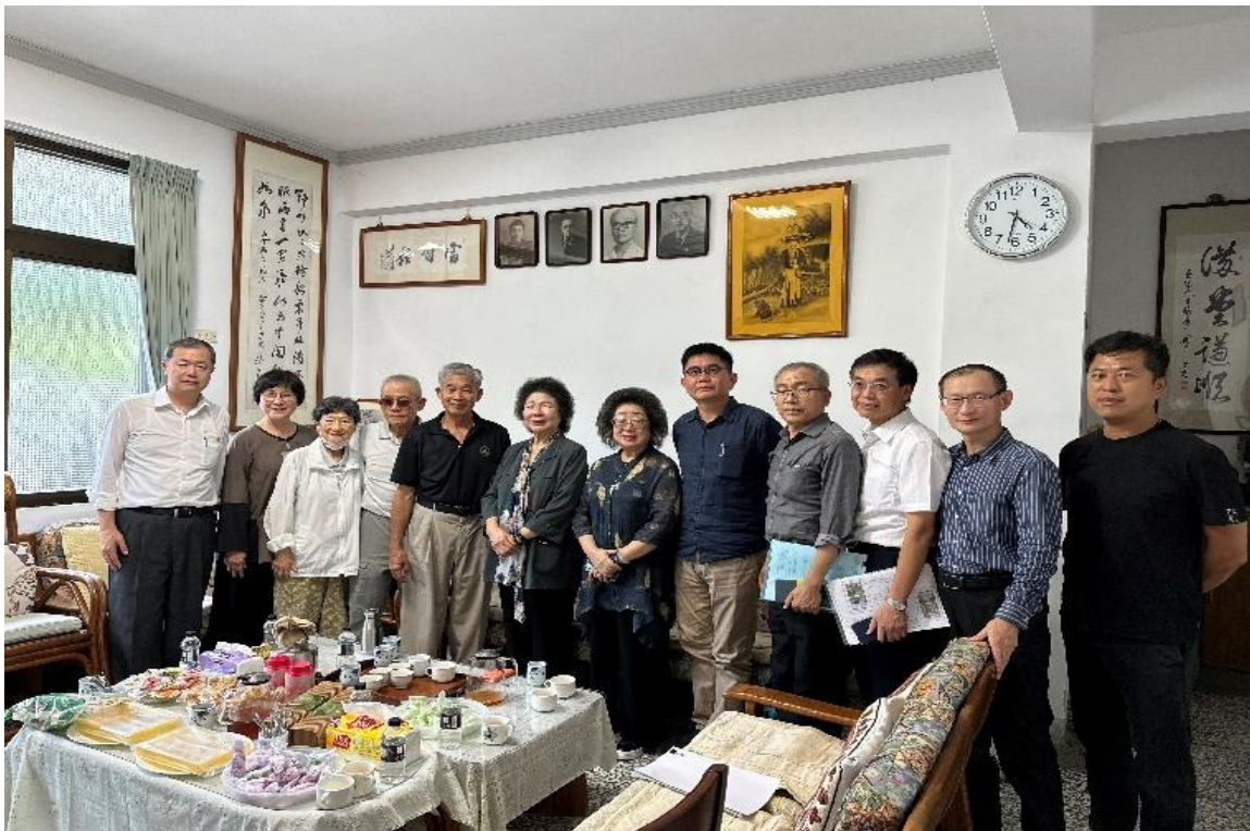
張七郎家屬訪談並反應現有維護管理之困境