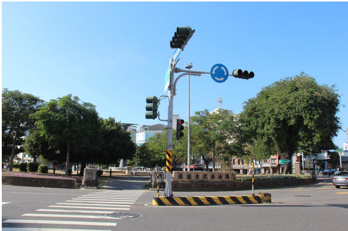
湯德章紀念公園（臺南原民生綠園；審定不義遺址）