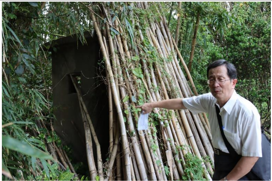
家屬指出徐厝側門外的崗哨亭構造物