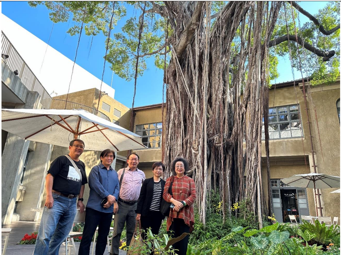
原臺南警察署（現為臺南市美術館一館）中庭