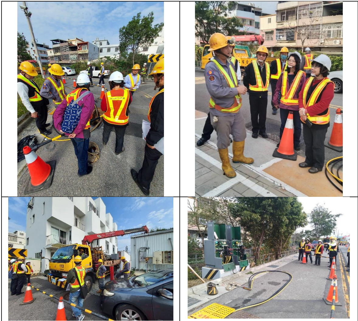
表10 新竹區營業處112年丙工區配電外線及零星管路綜合工程-2