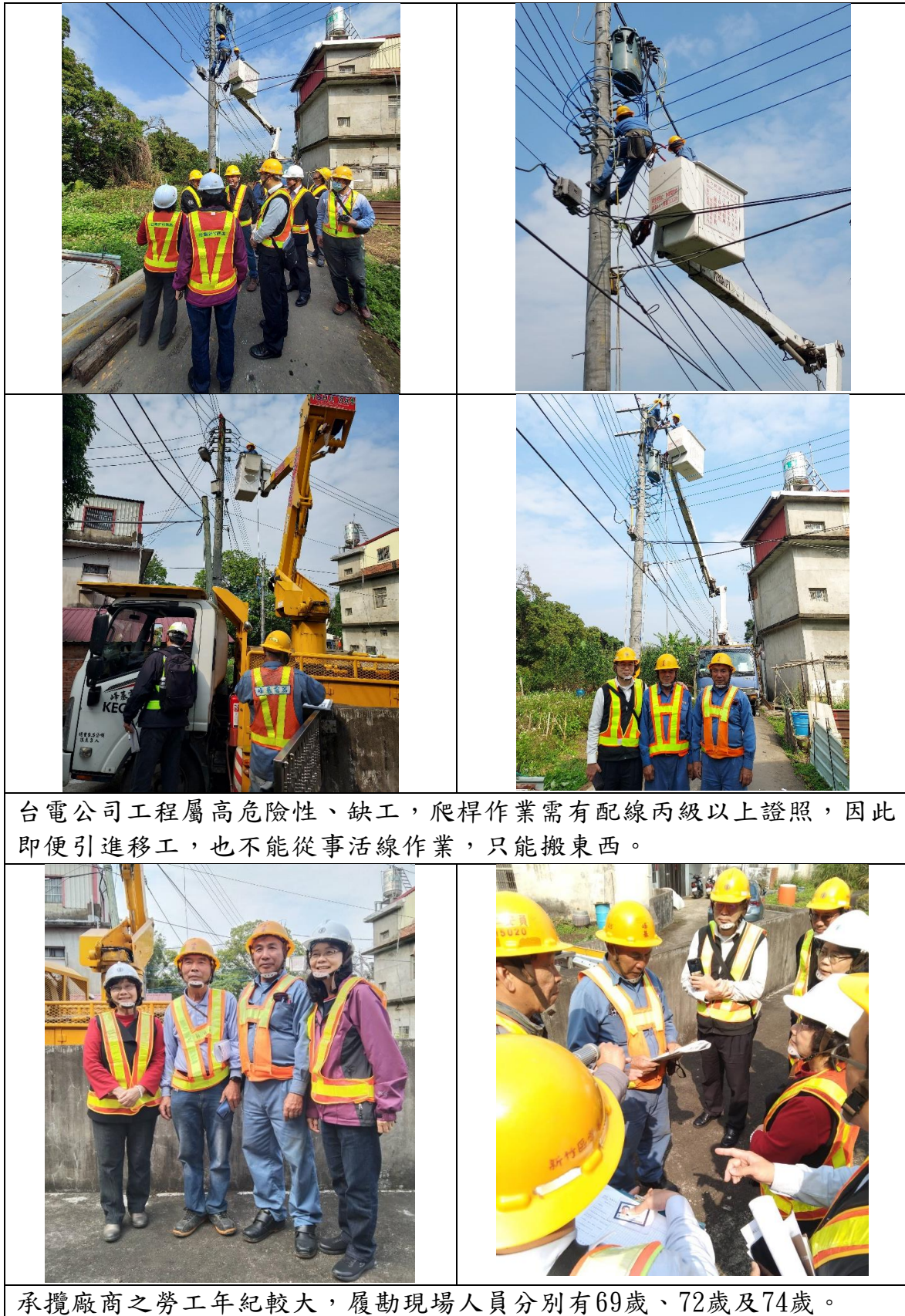
表9 新竹區營業處112年丙工區配電外線及零星管路綜合工程-1