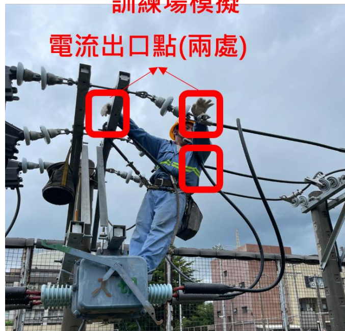
圖1 台電公司外包廠商112年8月2日於南投縣魚池鄉維修電桿之感電死亡現場及模擬圖