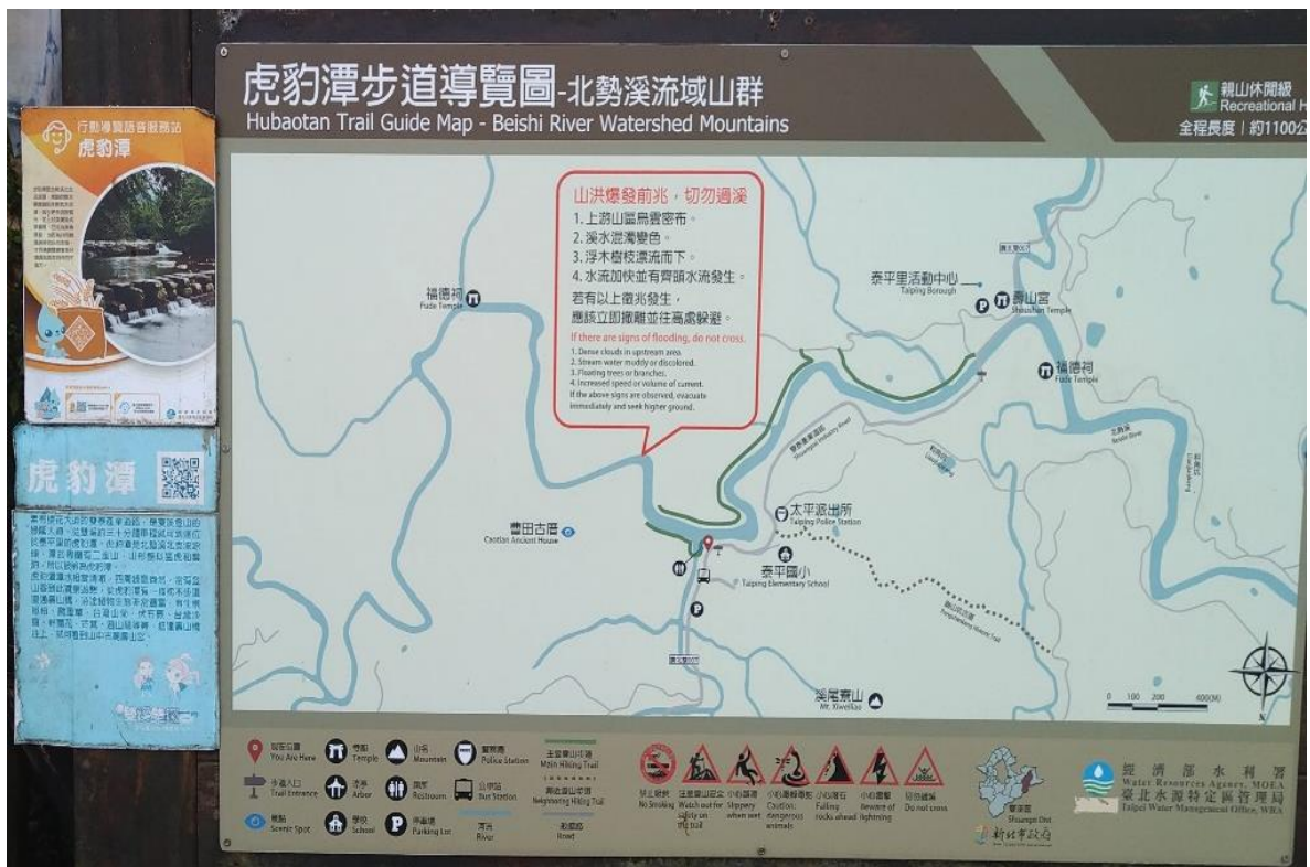
圖3 事發後新北市雙溪區公所增設「山洪爆發前兆，切勿過溪」告示牌