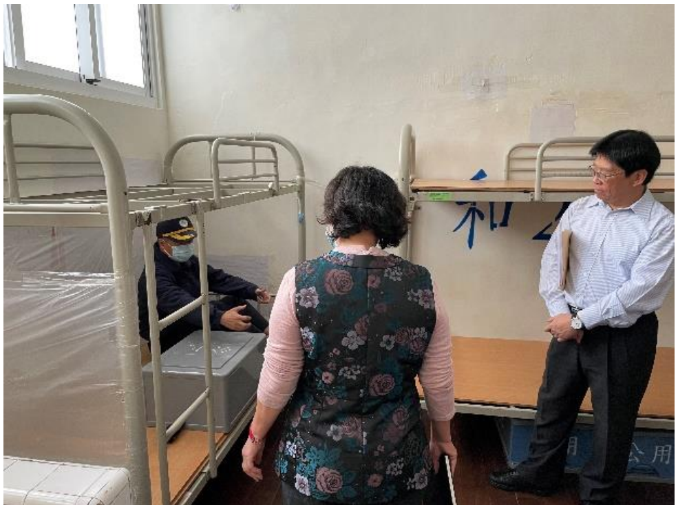
圖2 戒護科長許○○模擬說明黃A○於床上自殺情形