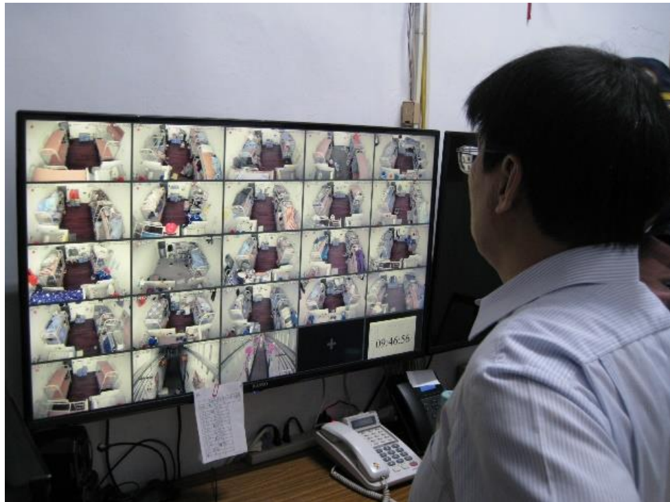
圖3 黃A○自殺地點南二監和舍值班台監視畫面勘查