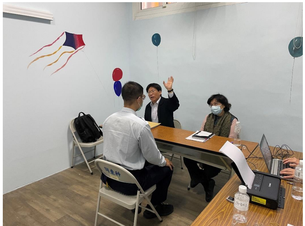
圖9 詢問南二監戒護科員陳○○受理陳情情形