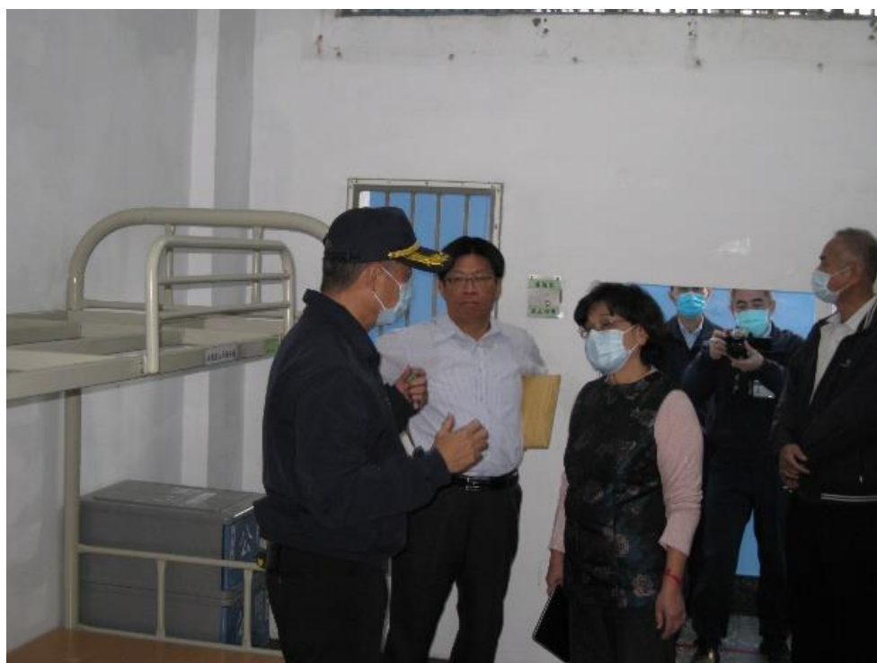
圖4 本院無預警履勘：南二監戒護科長許○○說明黃B○自殺情形，該監並以此案例向同仁宣導須特別留意收容人於舍房內動態，以加強監控之識別度