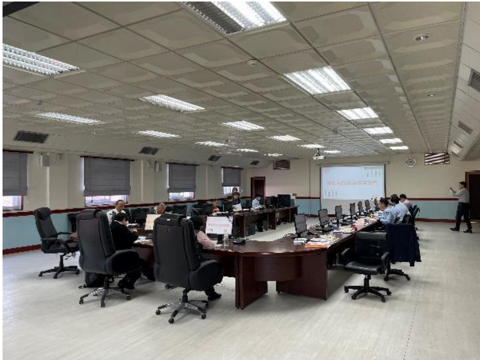
圖10 監察委員與南二監相關主管、承辦人員座談情形