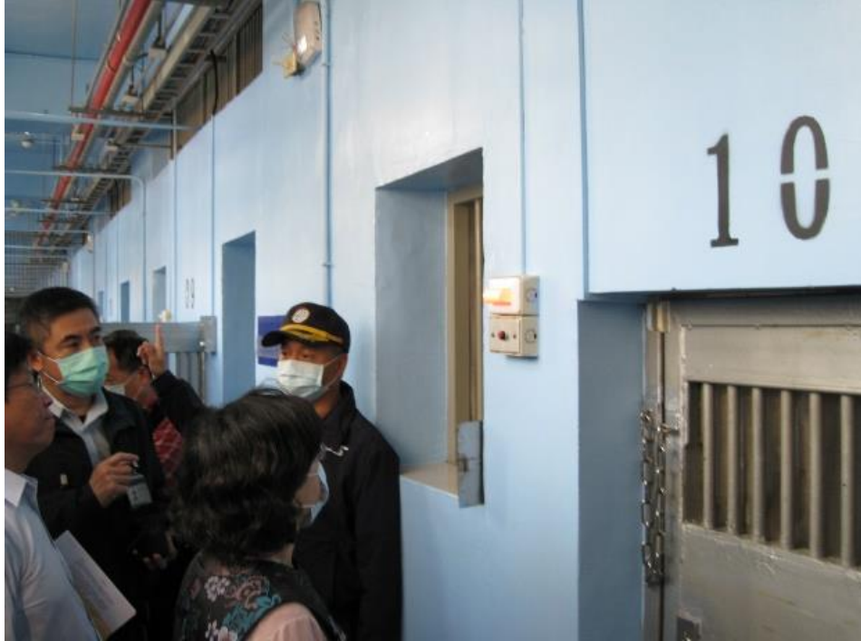
圖5 黃B○自殺地點-禮舍10號舍房緊急鈴、報告燈測試情形1