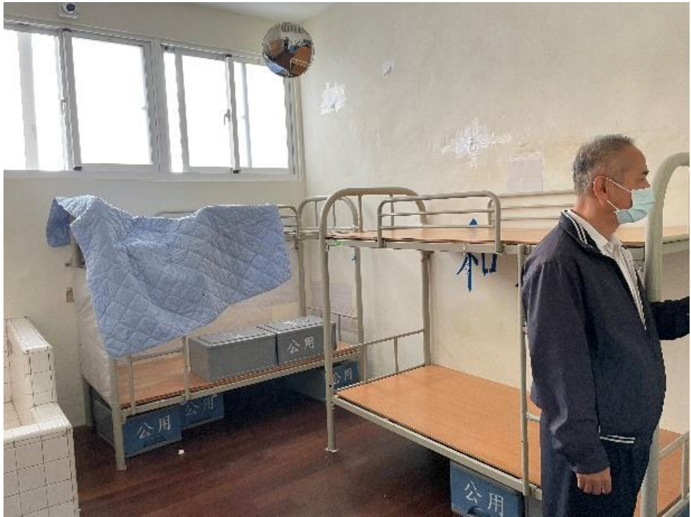
圖1南二監秘書李○○模擬說明黃A○以棉被遮掩自殺情形