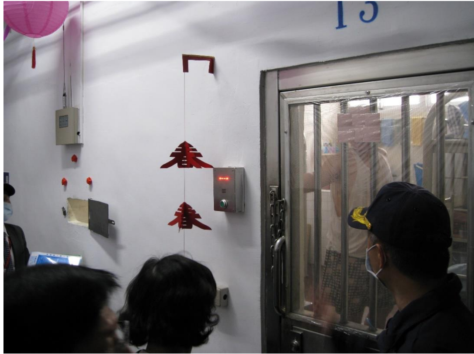
圖7 黃A○自殺地點-南二監和舍13房緊急鈴、報告板勘查