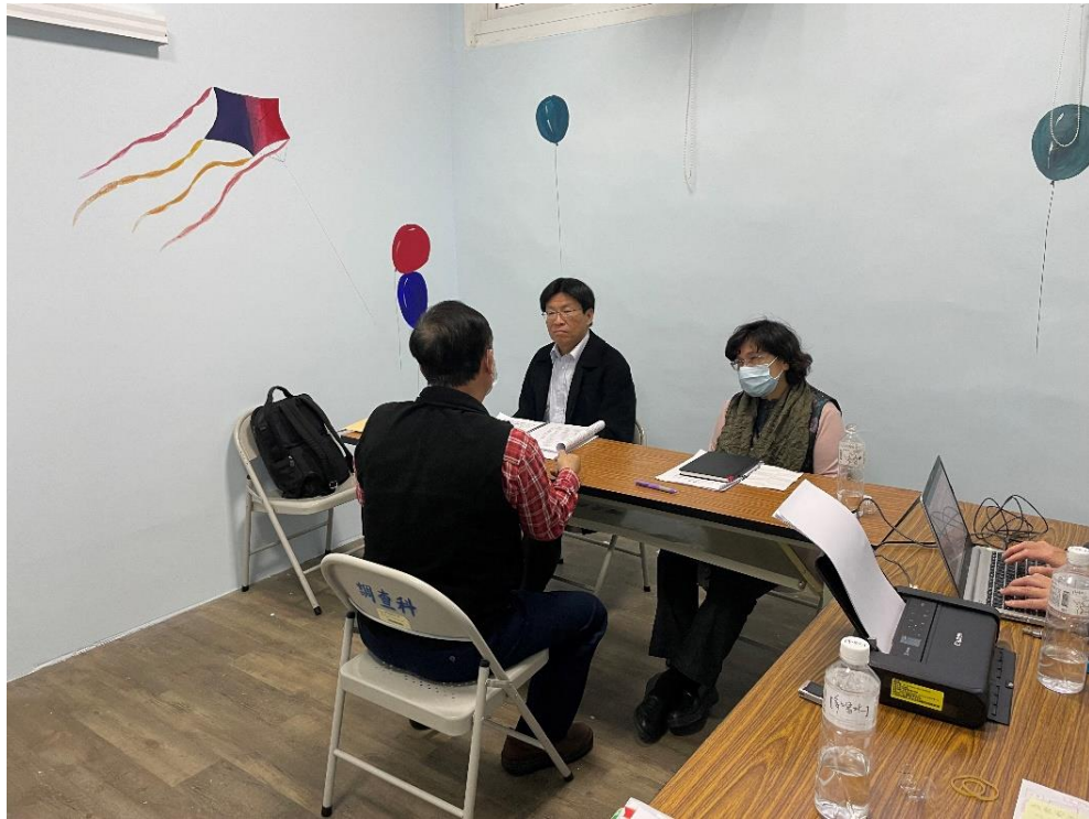
圖8 詢問南二監政風室主任受理陳情情形