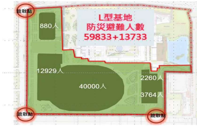
圖2 全區防災電腦模擬73,566人各區人數分布圖