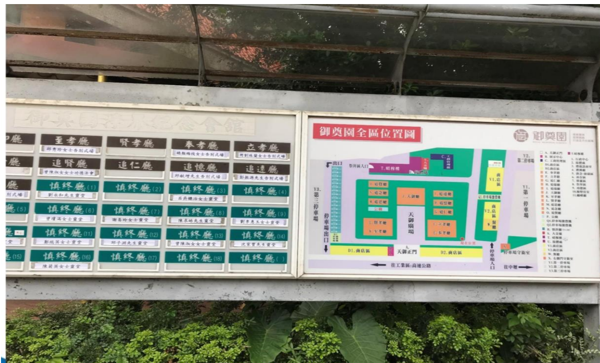
圖2、殯葬設施經營業者(御奠園)提供違法擴建殯葬設施供民眾使用(核准7間禮廳，實際卻有11間禮廳及18間靈堂)