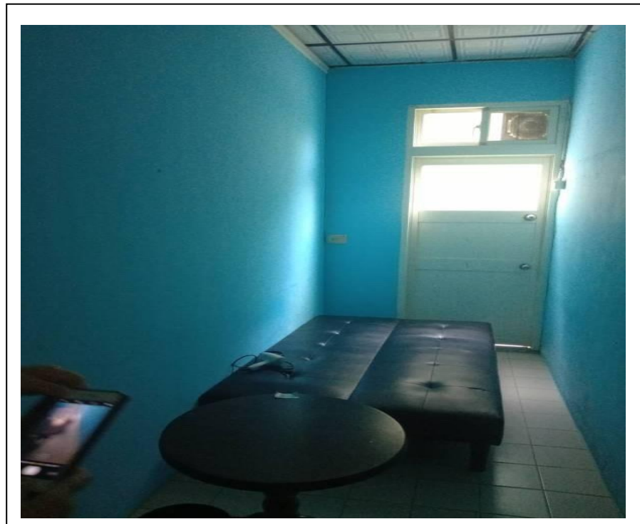
圖2 德芳教養院隔離室2