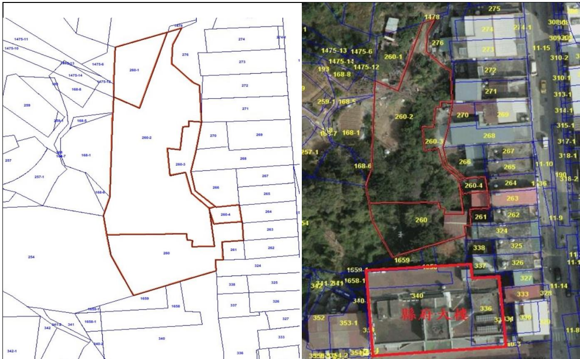
圖1、系爭土地地籍圖與空照圖