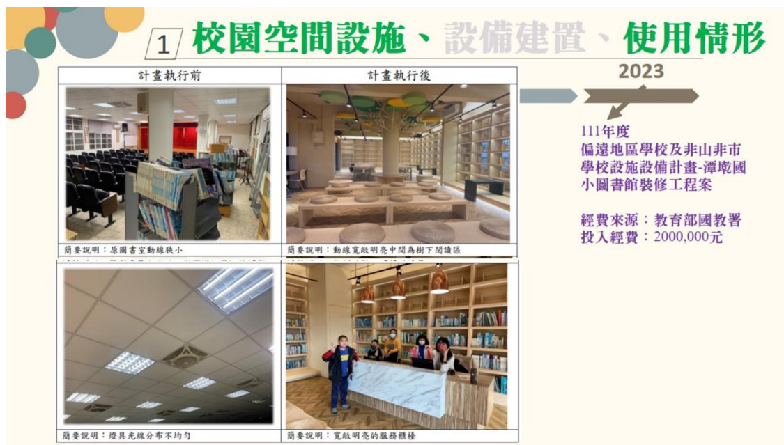
圖3 潭墘國小裝修圖書館之情形