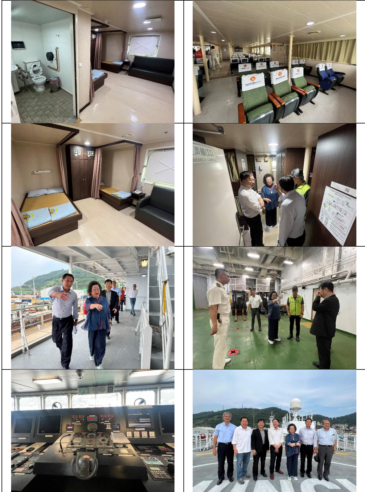
表2 「臺馬之星」現況相片一覽表