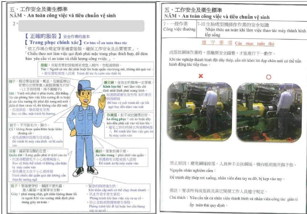
圖2 B輪胎公司每日晨會導讀公司安全衛生工作守則內容節錄。

(2) 移工C：「第1次來臺就在這間公司，在公司第5年，續約時沒有再付錢，目前在整型部門工作」、「在越南時有受過訓練，有給教材(書)，有圖片，關於機器操作都是看書，來公司前沒有實際操作過」、「來公司之後，公司是安排一個前輩帶一個新人，沒有一起上過(說明機器如何操作的)課」、「知道公司發生過職災，有人受傷，剛來公司的時候科長有說；剛來公司的時候很擔心(受傷)，所以會更小心，有新人來的時候也會提醒新人；會跟新同事說明比較危險的機器」、「每年都有做健康檢查；每日晨會有用越南語導讀安全衛生工作守則」。