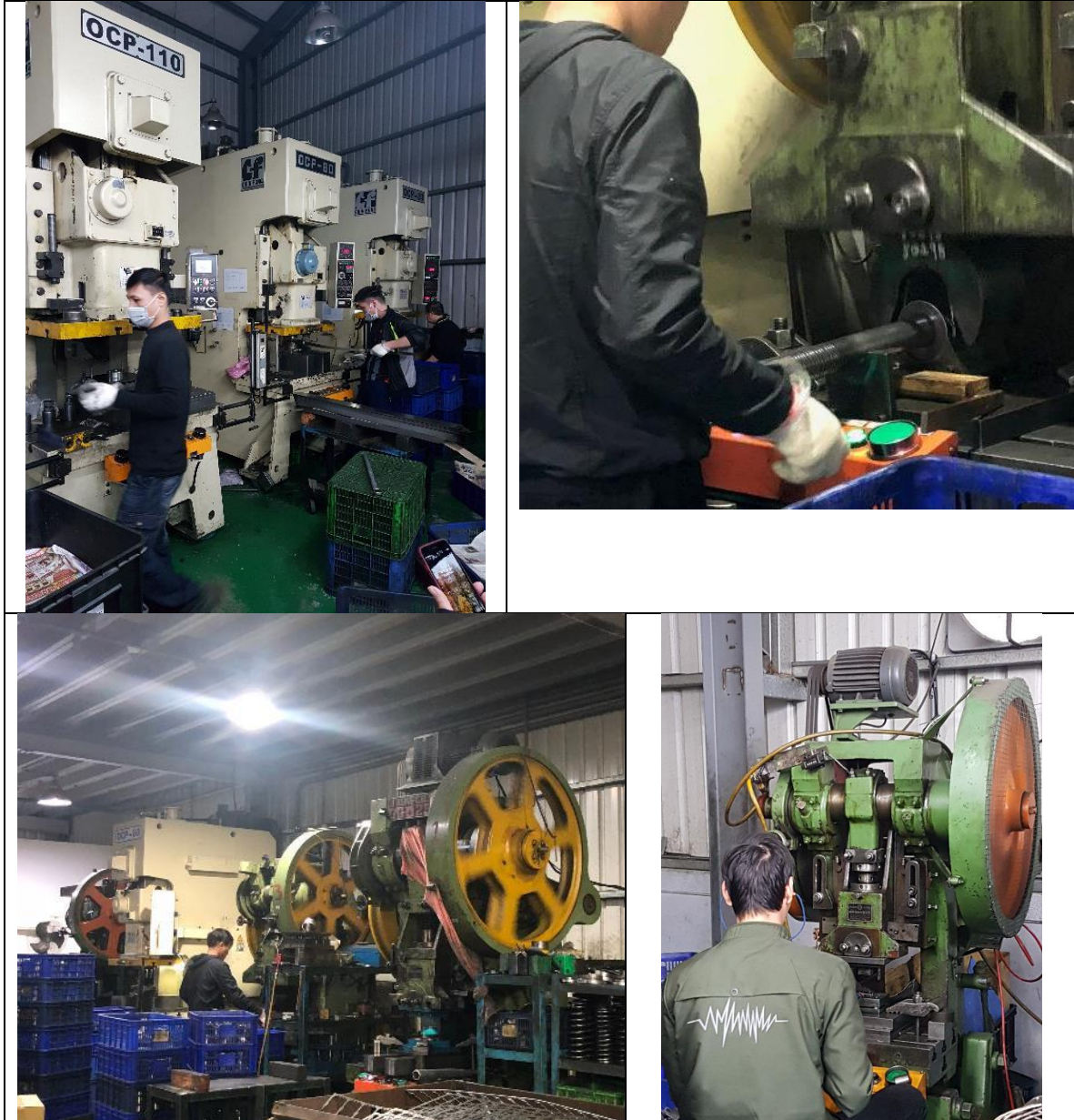
圖6 E企業公司作業現場

受傷，那是跟我同時來臺灣工作的朋友，但因為每個人都是做不同的工作，所以不清楚他是怎麼受傷的」。