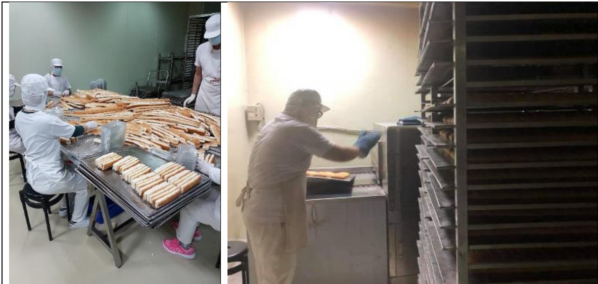
圖5 D食品公司作業現場