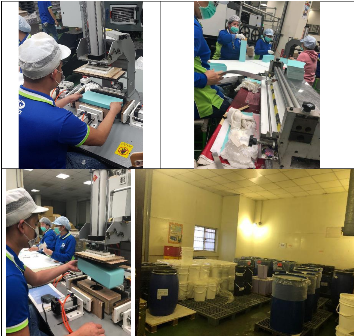
圖7 E企業公司作業現場

(四)綜上，本案履勘曾發生移工職災的廠場，發現勞動檢查機構多次檢查令限期改善，或列入專案輔導的事業單位，仍存有重大潛在危險的缺失，足見輔導建議、追蹤改善未盡落實。另外，工廠的危險警示標語缺乏移工熟悉的文字、缺乏對移工完整的勞工安全教育與訓練、沒有適當的教材及翻譯、端賴資深移工教導等現象普遍存在，均是移工持續發生失能職災的關鍵因素，勞動部允應檢討改進。