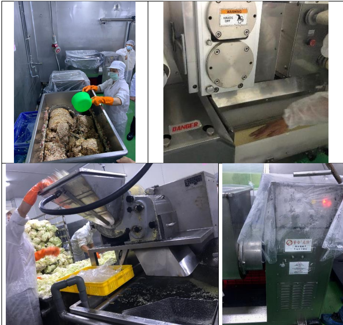
圖1 A食品公司作業現場。

2、於108年11月25日履勘彰化B輪胎公司時抽訪不同年資移工各一人及雇主代表：