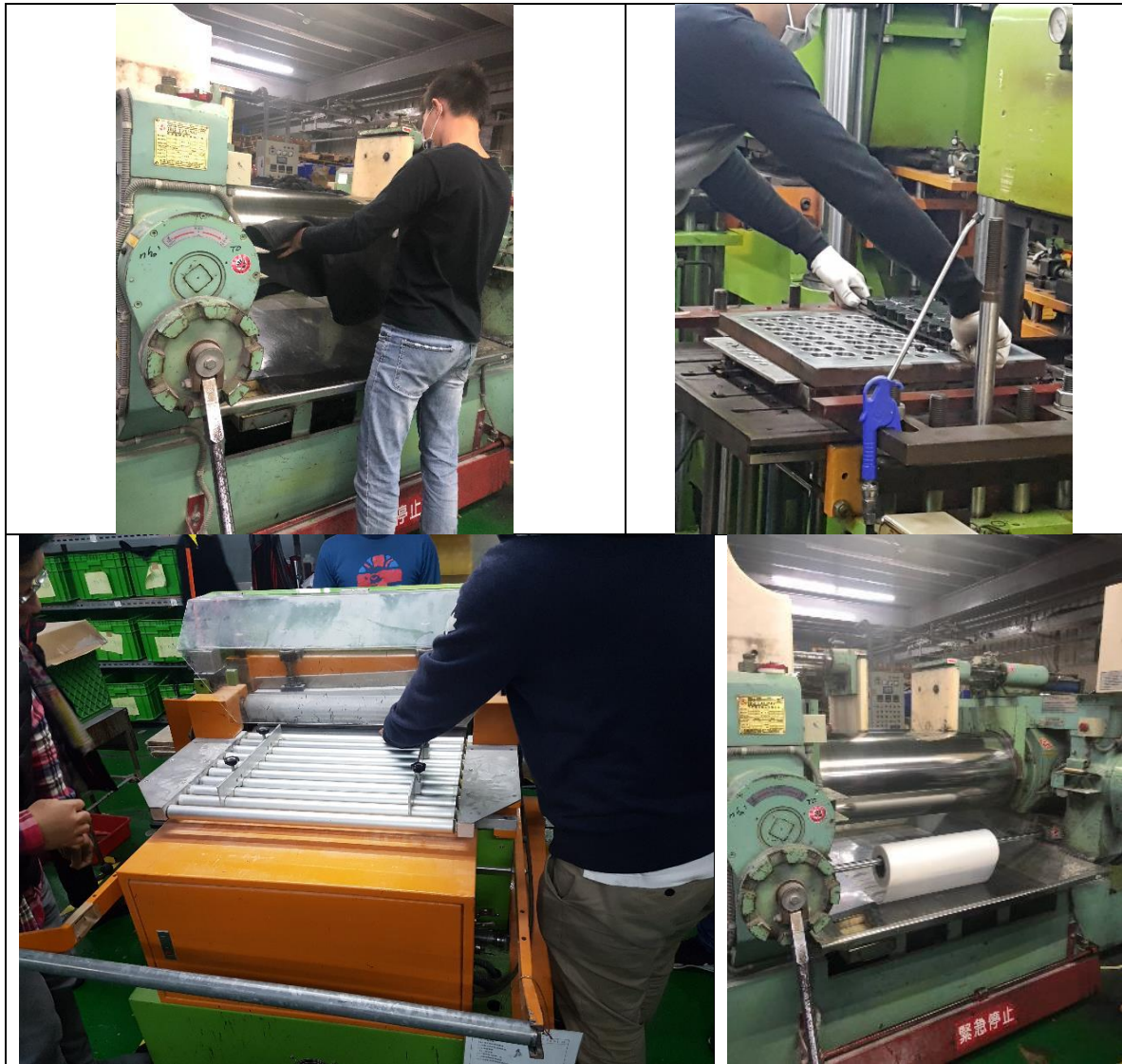
圖4 C橡膠公司作業現場。