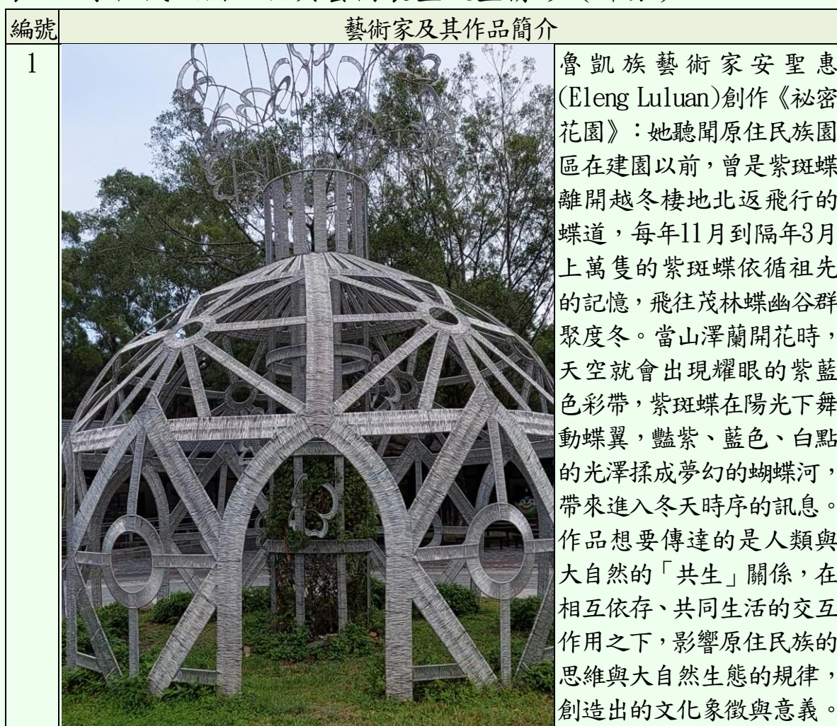
表9 原住民族園區公共藝術裝置設置情形（部分）