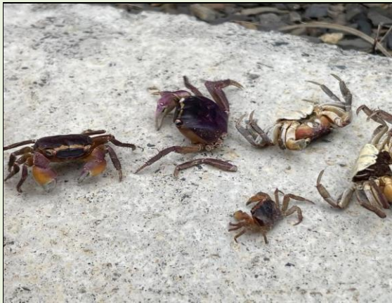
道路現場所見陸蟹