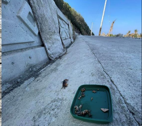
攀爬麻布袋和所見陸蟹