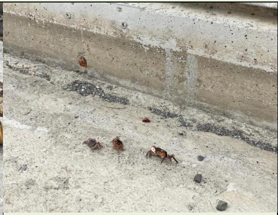
水泥路面和擋土牆所見陸蟹