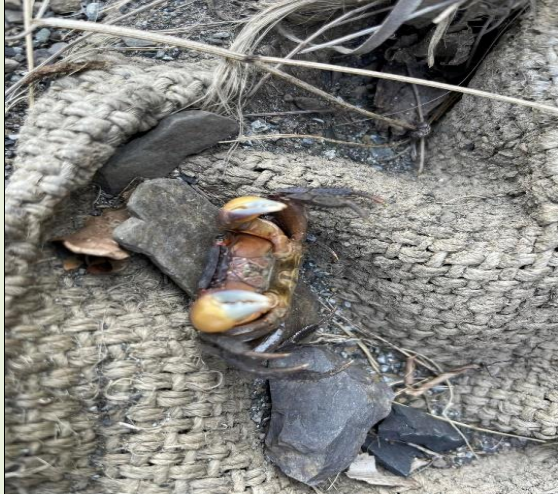
攀爬麻布袋和所見陸蟹