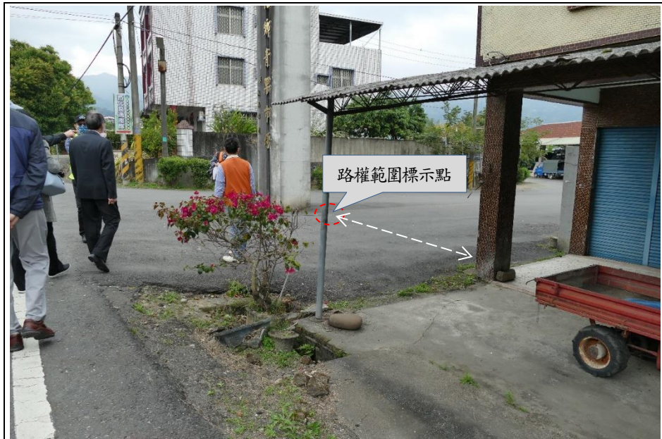
本院111年2月14日履勘照片，可見台20乙線20公尺寬路權範圍確實影響民宅騎樓樑柱，且民宅與道路存在相當程度的高底差。