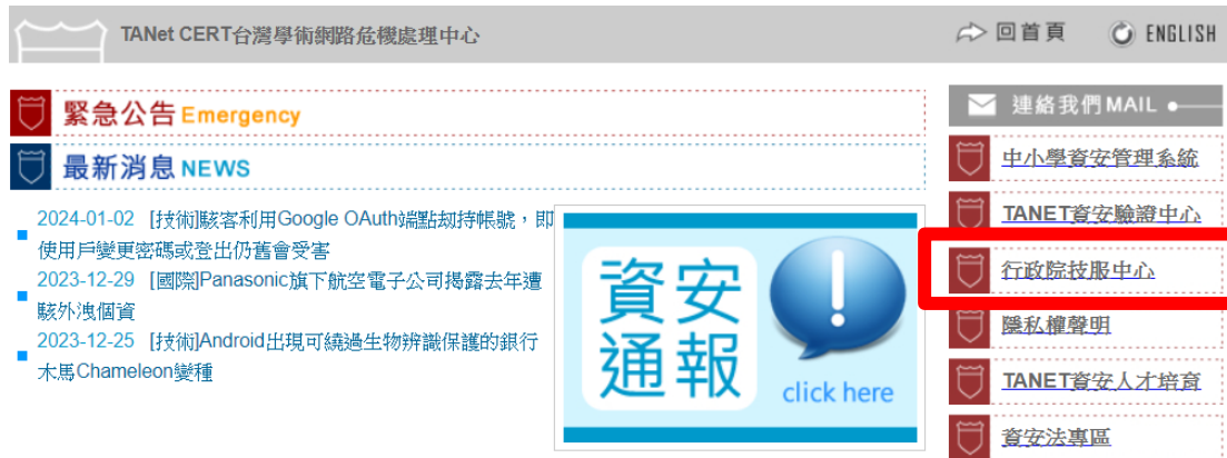
圖1 TACERT網頁仍將改制之行政院技服中心至於首頁連結