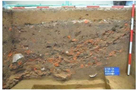
圖版 2：赤嵌園區遺構調查計畫-P12 北界牆照