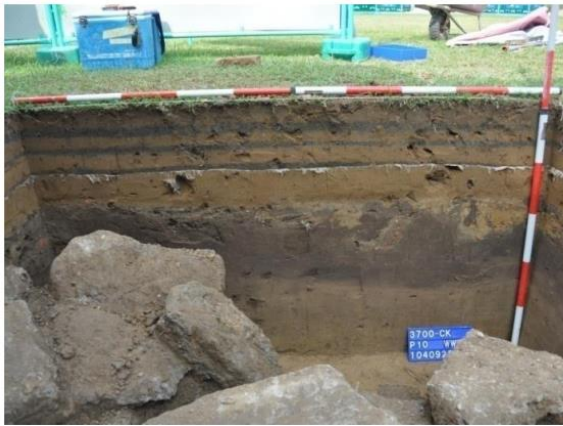
圖版 1：赤嵌園區遺構調查計畫-P10 西界牆照

署遺構、日治時期校舍遺構及灰坑，以及戰後迄今之地層堆積。其中7處探坑出土清代紅磚遺構，經歷史圖資套疊後，推斷應為臺灣縣署及其附屬建築群。故105年6月庶古公司通報主管機關文資處，經105年9月9日第三屆臺南市遺址審議委員會第10次會議列冊追蹤審查決議事項，赤嵌疑似考古遺址敏感區範圍的劃設以既有道路及其街區為主（東：赤嵌東街，西：赤嵌街，南：民族路二段，北：成功路），街廓範圍內以成功國小及赤嵌園區為主。