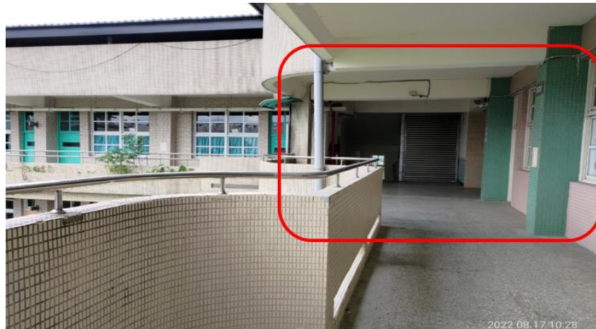
圖3 本院履勘甲師帶學生私下且單獨審訊之場域