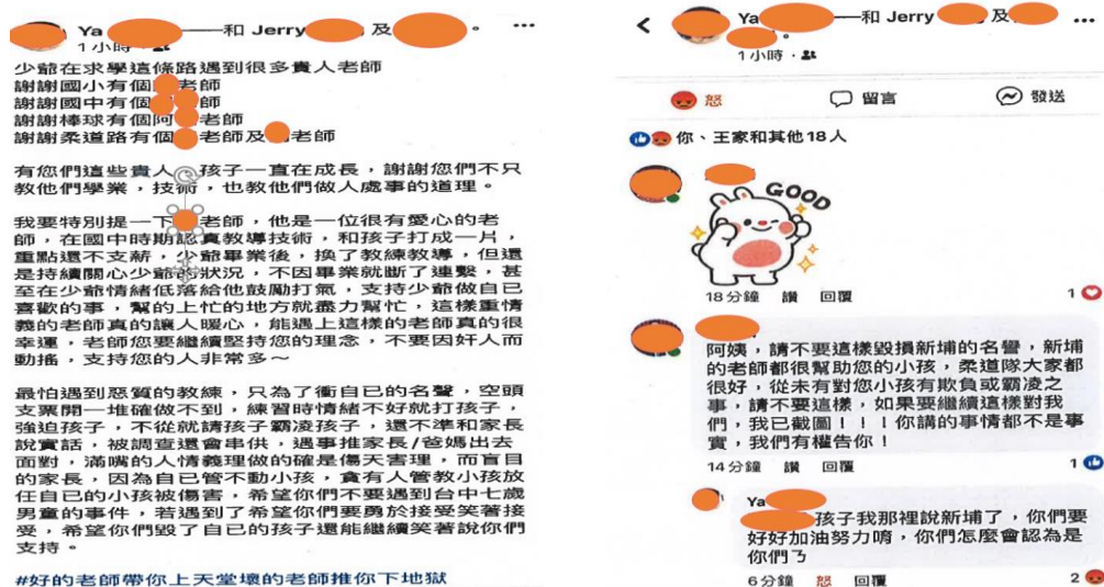
圖4 110年5月新埔國中前柔道隊家長PO文內容摘述

生，他9年級。」另對於學生指稱不講實話就要帶去警察局一事，甲師表示：「我沒有說不講實話就要帶去警察局」、「我只有跟他們說，你們打在網路上，要自己負責」、「因為臉書回覆內容有提到霸凌跟打人家。我問小孩Po文的動機、有無被指使。是已轉學的學生家長跟我反應，所以我才去調查。我要了解動機，因為我才能跟家長回覆。如果是被指使，我要去追為什麼家長要指使小孩」云云。