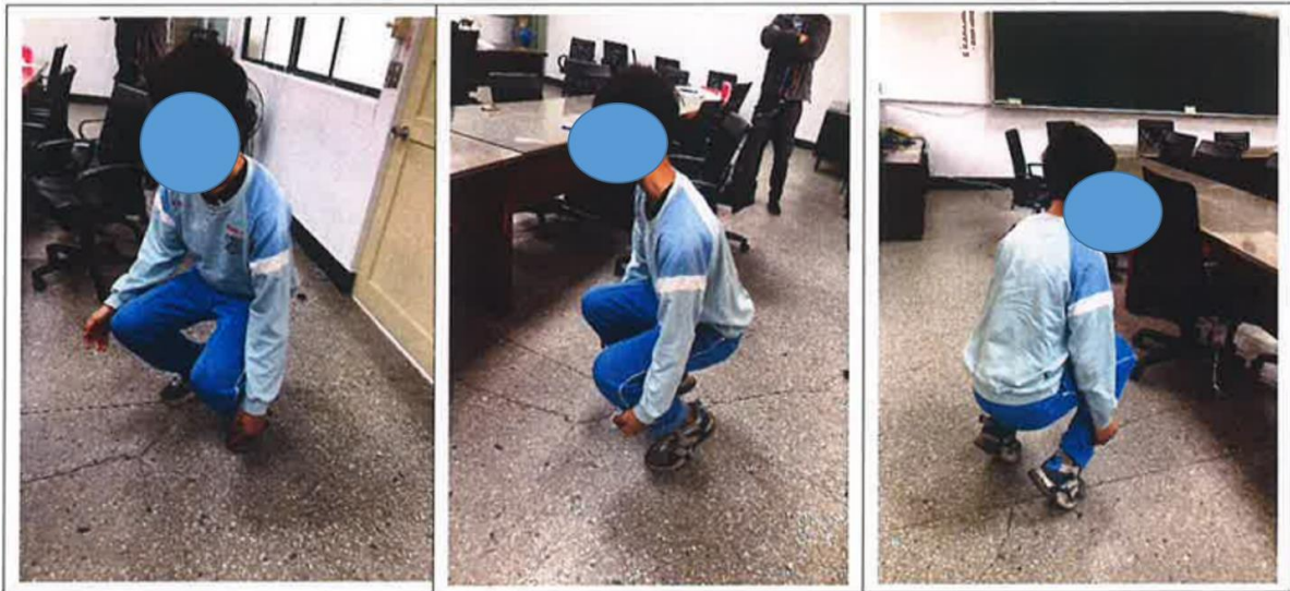
圖2 A生於新埔國中校事調查小組訪談過程中被要求示範半蹲之情形

另該次校事調查小組訪談A生關於是否被處罰半蹲一事，訪談過程中，調查小組請A生示範蹲姿，A生示範情形如下圖2。