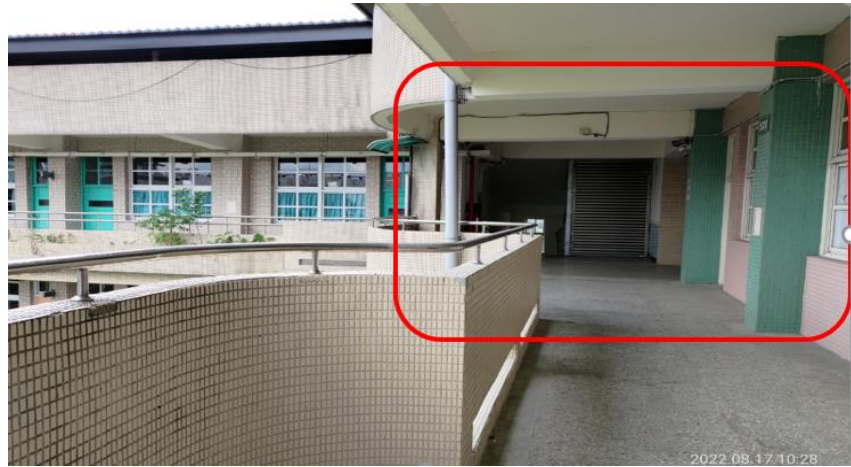
圖3 本院履勘甲師帶學生私下且單獨審訊之場域