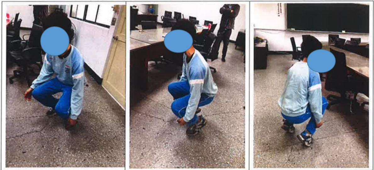
圖2 A生於新埔國中校事調查小組訪談過程中被要求示範半蹲之情形

另該次校事調查小組訪談A生關於是否被處罰半蹲一事，訪談過程中，調查小組請A生示範蹲姿，A生示範情形如下圖2。