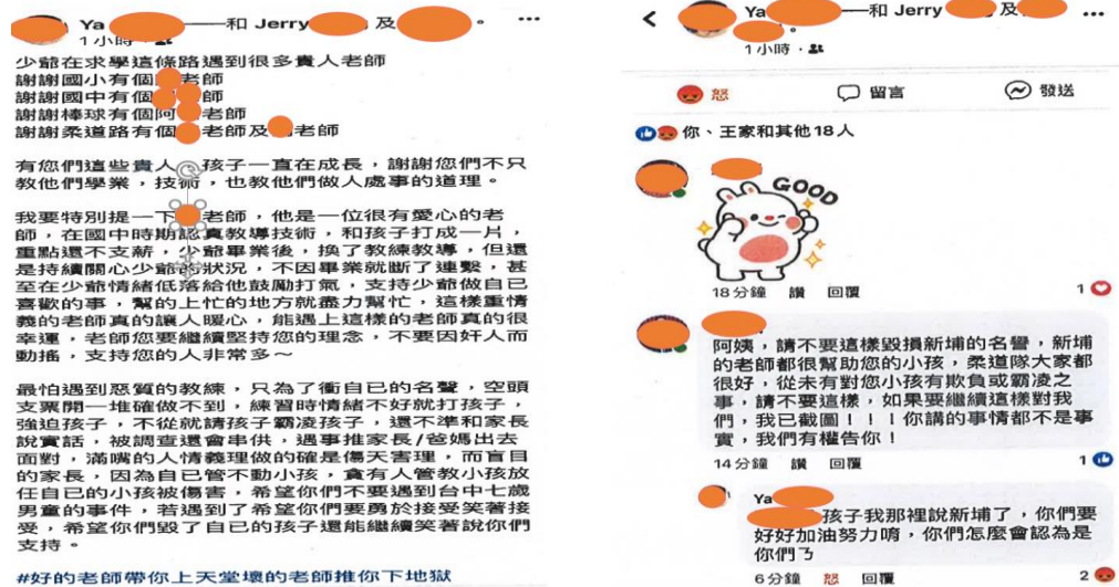
圖4 110年5月新埔國中前柔道隊家長PO文內容摘述

使。是已轉學的學生家長跟我反應，所以我才去調查。我要了解動機，因為我才能跟家長回覆。如果是被指使，我要去追為什麼家長要指使小孩」云云。