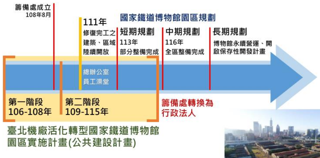
圖3 國家鐵道博物館園區規劃

至108年)主要為籌備執行工作,計畫推動以來,已依進度分年執行整體園區之調查與規劃、修復作業、展示空間建置作業、業務推廣計畫等。