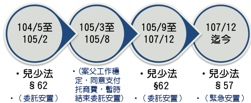
圖2 宜蘭縣政府乙個案適用法條發展情形圖