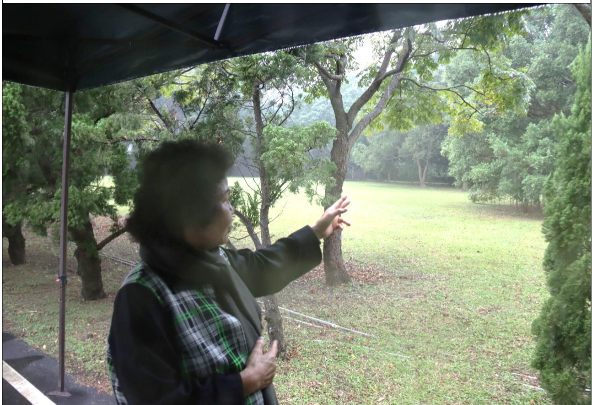
當年女學員區建築物位於營區西南角（現為空地）