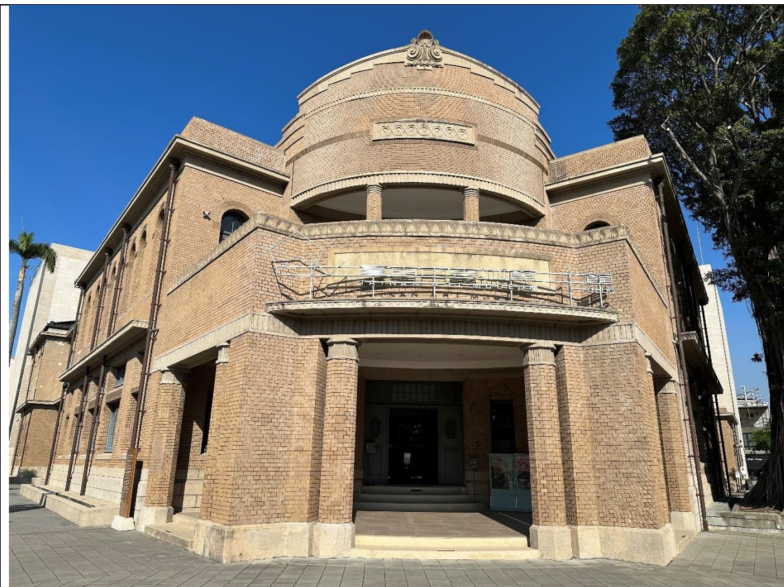
原臺南警察署（現為臺南市美術館一館）大門