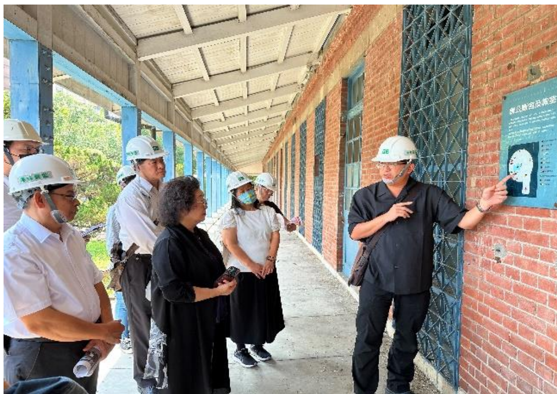
原海軍總司令部情報處拘留所（海軍明德訓練班）