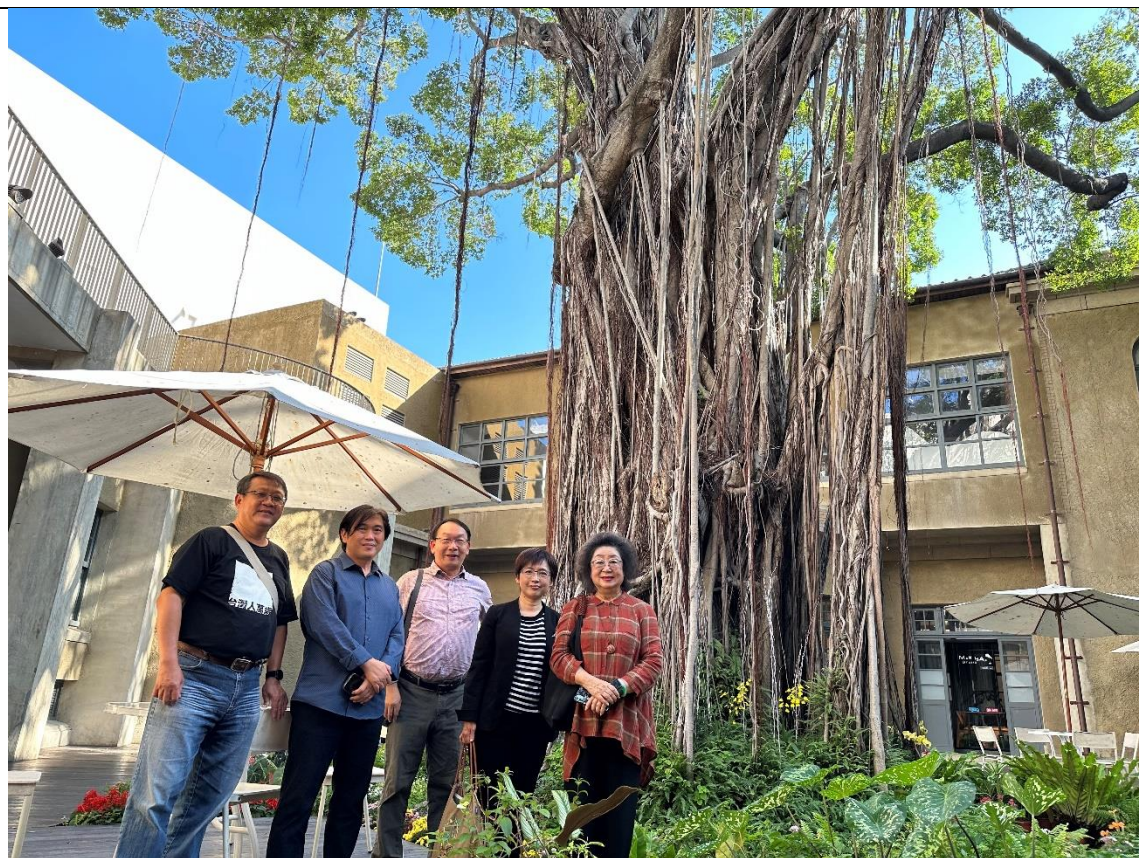
原臺南警察署（現為臺南市美術館一館）中庭