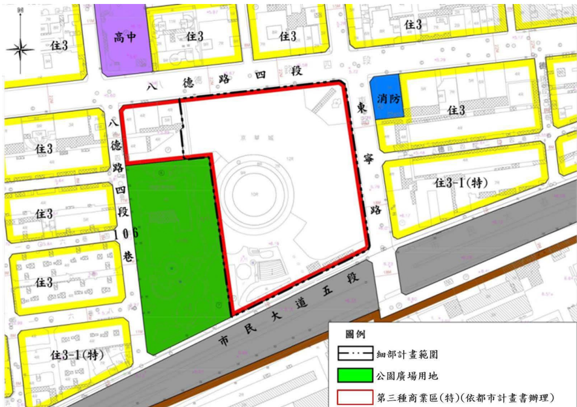
圖1 本件細部計畫修訂案範圍示意圖

積保障」本質僅屬一次性保障之期待利益，並不具用以轉換申請容積獎勵之正當性；臺北市政府未依職權審究該細部計畫修訂案究竟如何符合都市計畫法第24條所定「配合當地分區發展計畫」之要件，卻仍草率同意受理該容積獎勵之細部計畫修訂案，顯有不當。