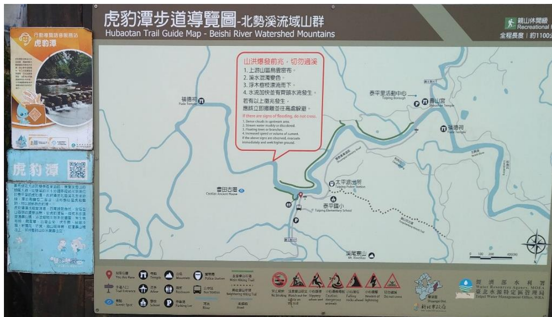
圖3 事發後新北市雙溪區公所增設「山洪爆發前兆，切勿過溪」告示牌