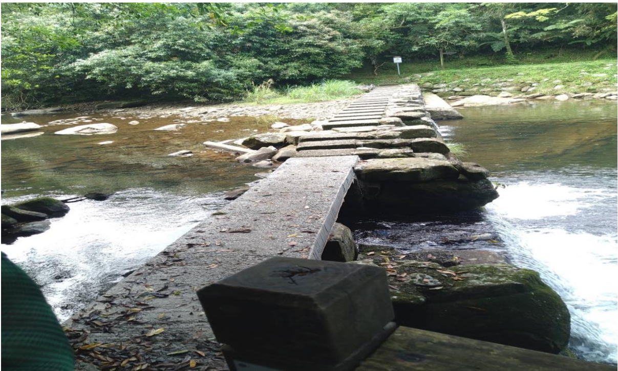
圖1 事發前虎豹潭跨溪石墩（石跳仔）【即報載梳子壩】

註：事發後石墩上木板已滅失，新北市雙溪區公所改鋪設水泥混凝土板塊。