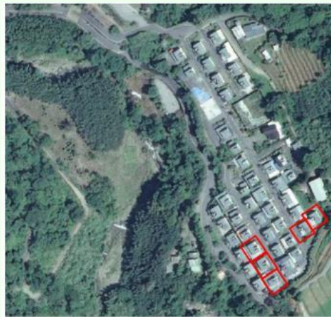
圖1、建物土地遭法拍之受災戶位置圖

及各項工程竣工後，應依規定將相關資料及經費收支(含補償相關表簿資料等)送原民會核銷、備查，並由縣府協助和平鄉公所輔導受災戶辦理建物重建、保存登記及土地移轉登記等作業。惟迄至110年3月至6月間，三叉坑部落遷建戶中竟有5戶建築基地遭法院拍賣移轉登記(圖1)，拍定人並於110年8月間及111年3月間寄發存證信函，又於111年6月間訴請拆屋還地，受災戶始發覺其房屋坐落基地並無土地所有權。