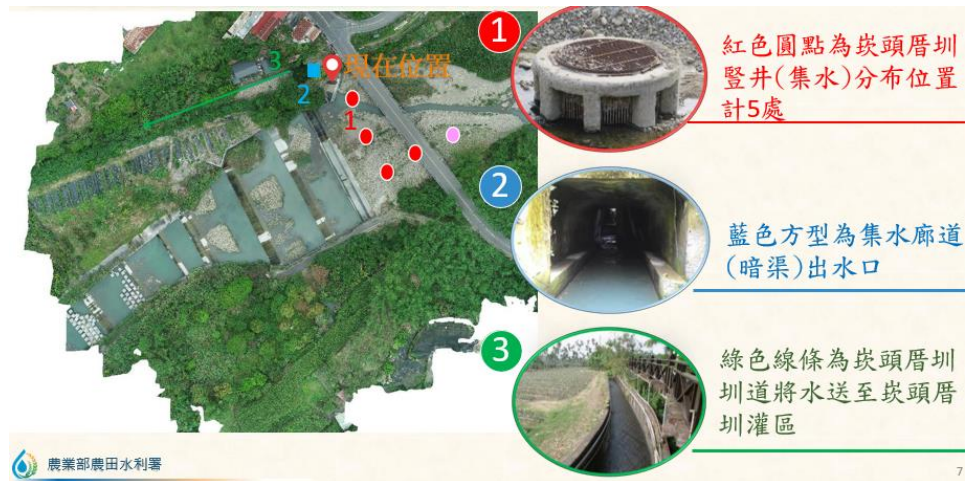
圖A、崁頭厝圳集水豎井分布示意圖

壞環境的情況下利用自然地形與水文性質，其特殊的水利工程設計，具有文化資產的科學文化價值。」爰雲林縣政府倘能參考屏東縣政府在96年現勘、登錄二峰圳的模式，邀請此方面之專家學者參與，針對5座豎井、集水暗渠、引水圳道等，進行文化景觀審查，相信能有不同風貌產生。