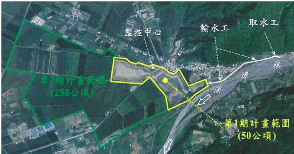
圖B、大潮州地下水補注湖第1期計畫範圍圖

(三)據丁澈士教授觀測 1 ，大潮州補注湖第1期工程於107年完工至110年6月之補注操作推估顯示，3.5年之引水量約3.43億噸，湖區2座沉澱池補注水量每年平均約4,657萬噸，3.5年累積補注量高達1.6億噸，有效在林邊溪沖積扇扇頂區域形成補注水丘， 扇頂區域的地下水全面抬升至少3公尺 ，扇央的地下水位抬升約0.1至2公尺左右，扇尾則水位變化較不明顯，亦仍有10公分的水位抬升，此距離補注湖區約為22公里，依此推斷在固定的補注條件下，水資源系統漸趨於穩定，整體含水層涵養增加，持續補注5年後含水層系統逐漸趨於穩定，由此觀之，大潮州地下水補注湖第1期計畫，利用地下水庫特性，將「洪水資源化」，利用洪水、蓄水地下、增源減洪，成效顯著。