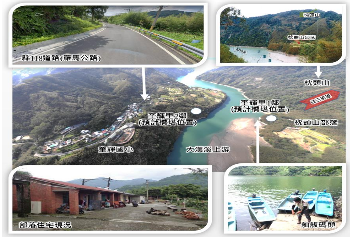
圖1 枕頭山部落地理位置圖

(二)石門水庫管理機關北水局因民意代表及村民多次反映，針對枕頭山部落建請設置永久通行道路或架設橋梁，以改善當地居民交通，於96年規劃興建吊橋供行人及機車通行，後考量該局非屬道路開發及管理機關爰撤案。嗣自98年7月起，改由復興鄉公所及原民局著手規劃改善（詳圖2），惟辦理迄今已13年餘，目前僅通過環境影響說明書審查，及完成工程細部設計，尚未進入實質施工階段，處理進度宛如牛步。從本案辦理歷程觀之，本案涉及都市計畫、環境影響評估、水庫水源特定區保護、用地取得（國有原住民保留地【已設定耕作權之繼承權】、私地價購徵收、撥用）、文化資產保存法【考古遺址發掘】等諸多法令，問題十分複雜，已非原民局己身之力得以克服完成，辦理過程且戰且走，毫無制度性規劃運作可言。查枕頭山部落自53年石門水庫竣工蓄