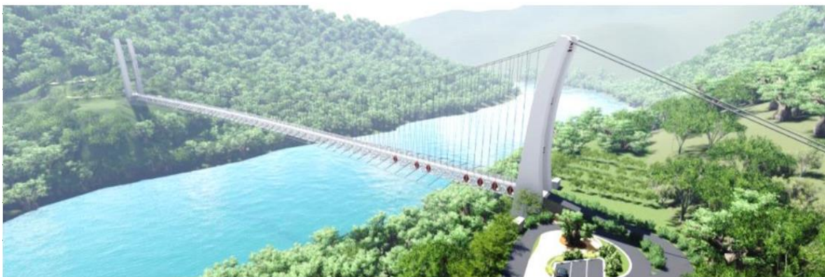
圖2 枕頭山部落聯外道路規劃圖