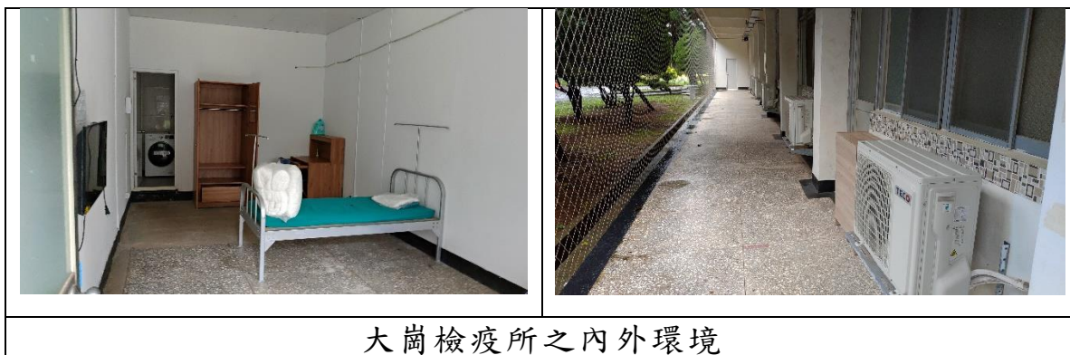
大崗檢疫所之內外環境