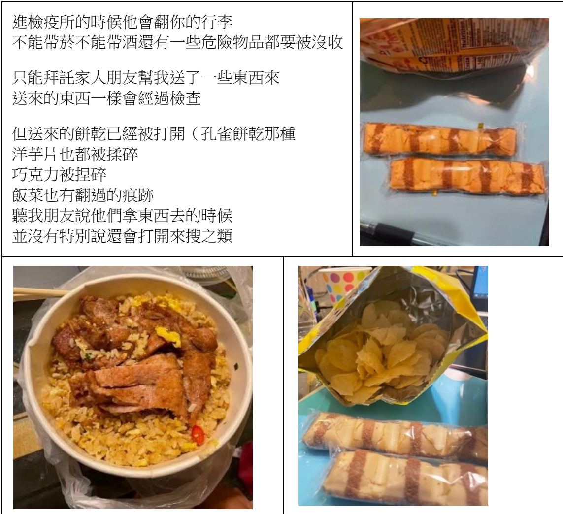
表1 「檢疫所的人翻我飯菜」貼文重點摘錄