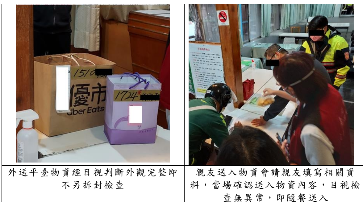
照片8 安心檢疫所對送入物資進行安全檢查

4、本案履勘時適逢有外送平臺及住民親友親送物資到所，安全組與後勤組人員依正常作業流程實施安全檢查。