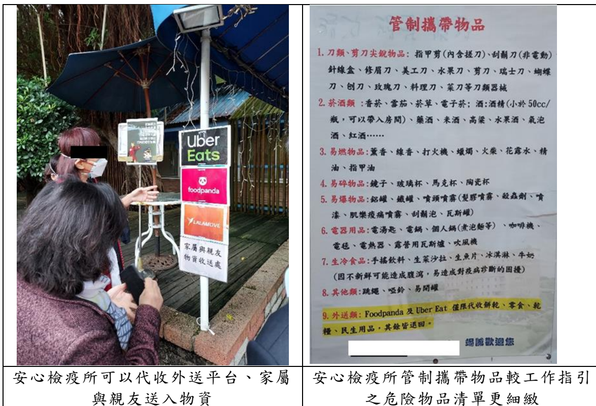
照片7 臺北市徵用安心檢疫所

4、本案履勘時適逢有外送平臺及住民親友親送物資到所，安全組與後勤組人員依正常作業流程實施安全檢查。