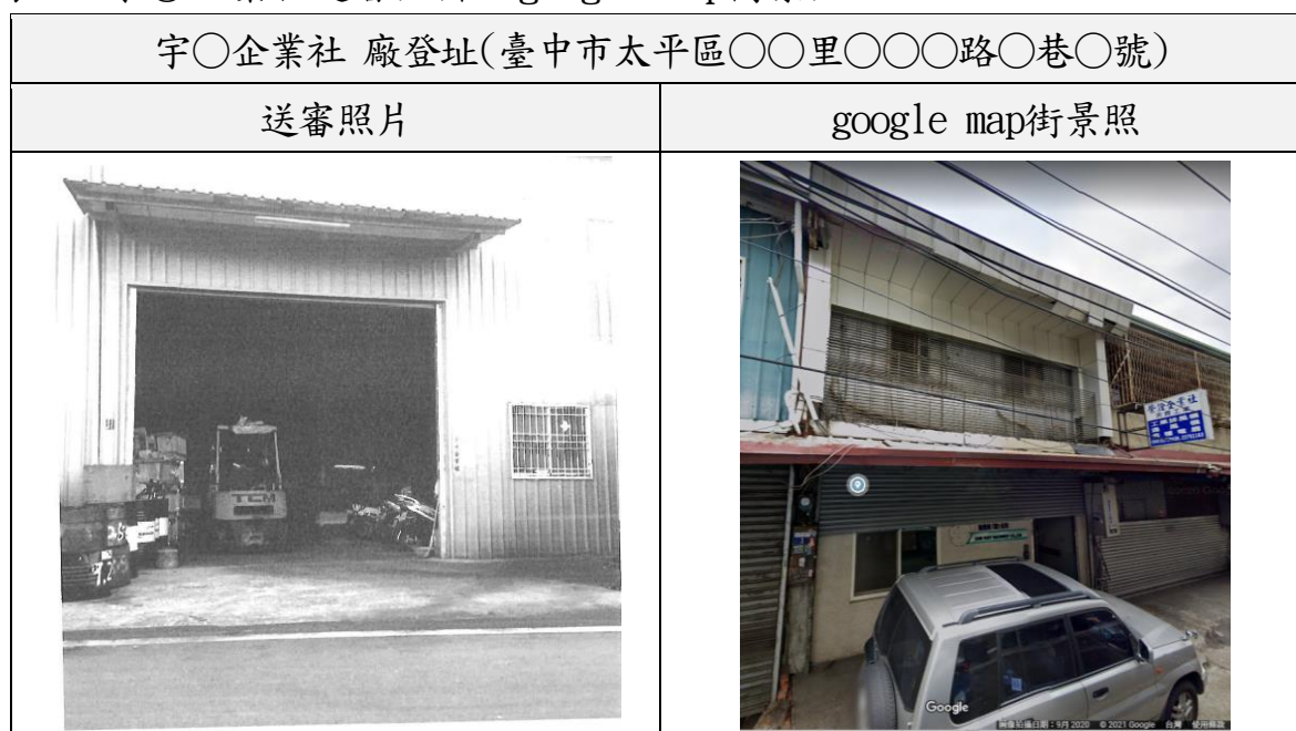
表3 宇○企業社送審照片及google map街景照