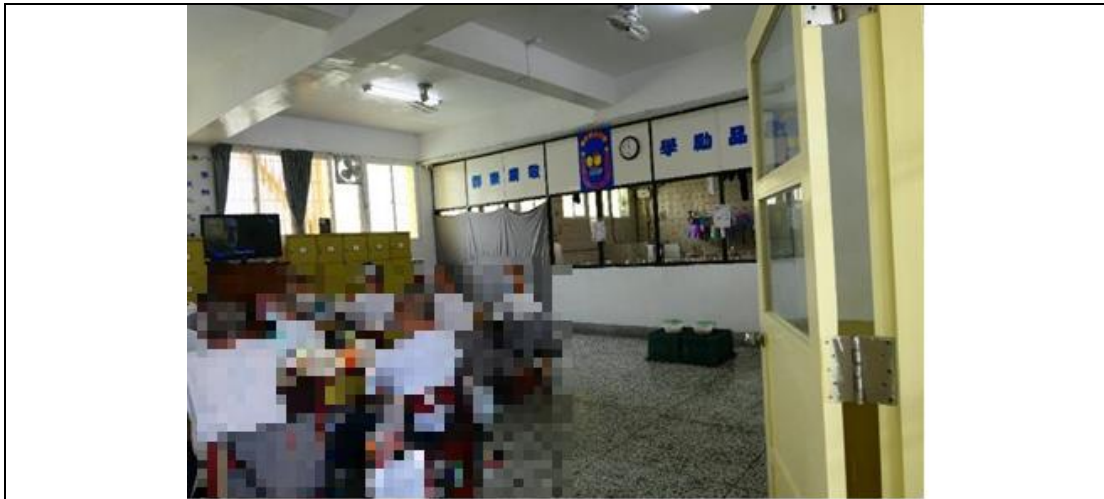
空大生活自習教室（以灰色布簾遮住廁所）

3、嘉義監獄辦理空中大學合作教學，本應以教育作為矯正目的，而非以管理方便為由，恣意選擇不適合教學場所，也不應以受刑人為次等國民，由監獄管理人員任意使喚。