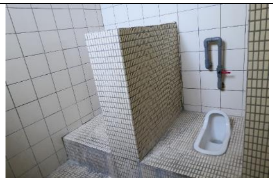
勇班教室黑板處後方廁所