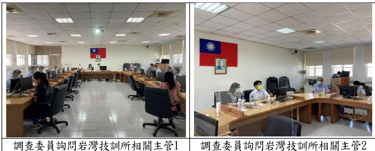
表4 履勘情形一覽表