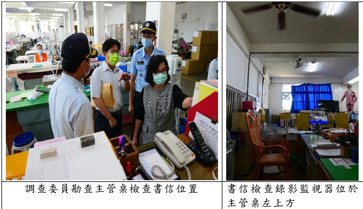
表3 履勘情形一覽表