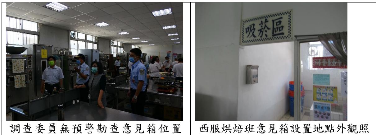
表1 履勘相片一覽表