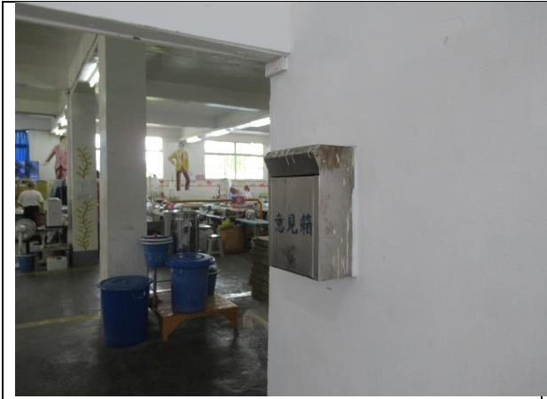
西服烘焙班意見箱側面照