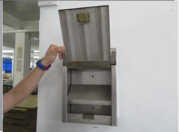
西服烘焙班意見箱內部照