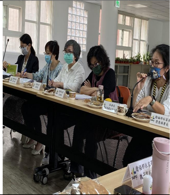
圖13：調查委員實地履勘並與機關人員座談。