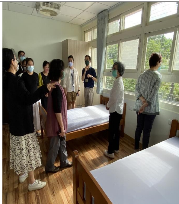
圖10：調查委員實地履勘個案住宿環境。