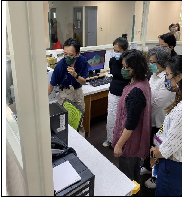
圖12：調查委員實地履勘。