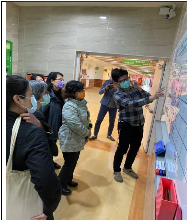
圖2：調查委員履勘高雄市情