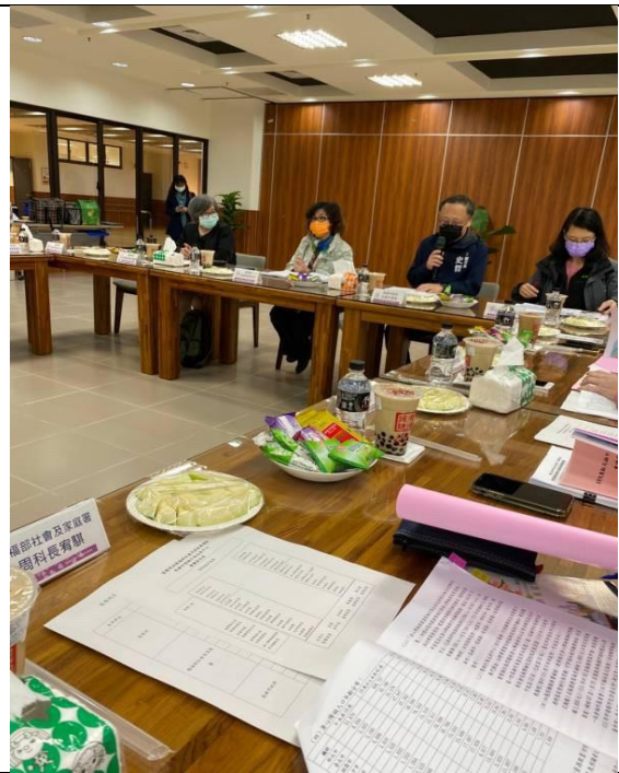
圖3：實地履勘並與機關人員