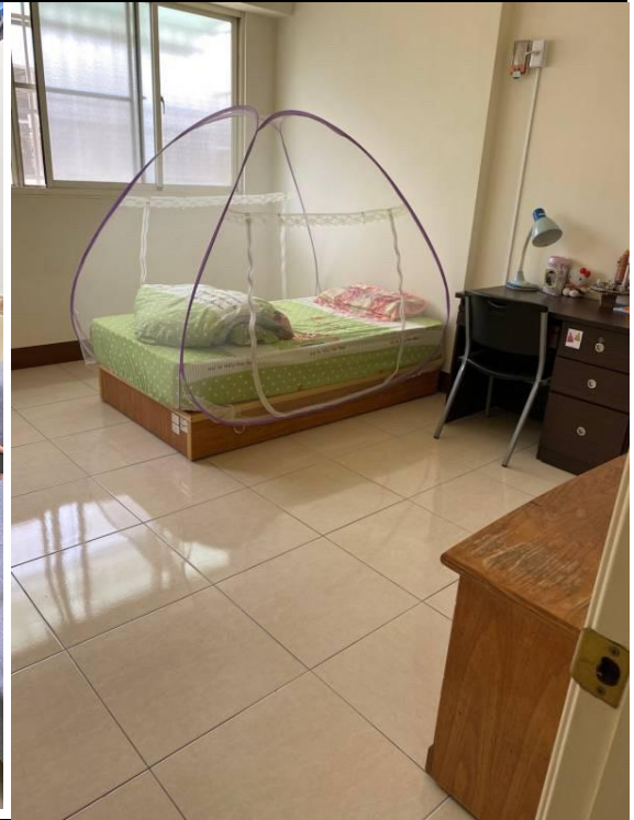
圖4：八福社區家園個案介紹 住宿環境予調查委員。