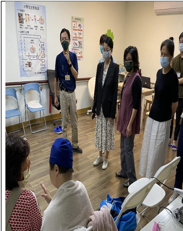
圖8：調查委員實地履勘身障個案水療情形。