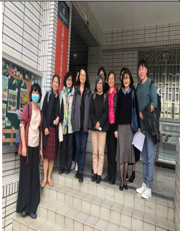
圖6：調查委員實地履勘五餅 二魚小型作業所。