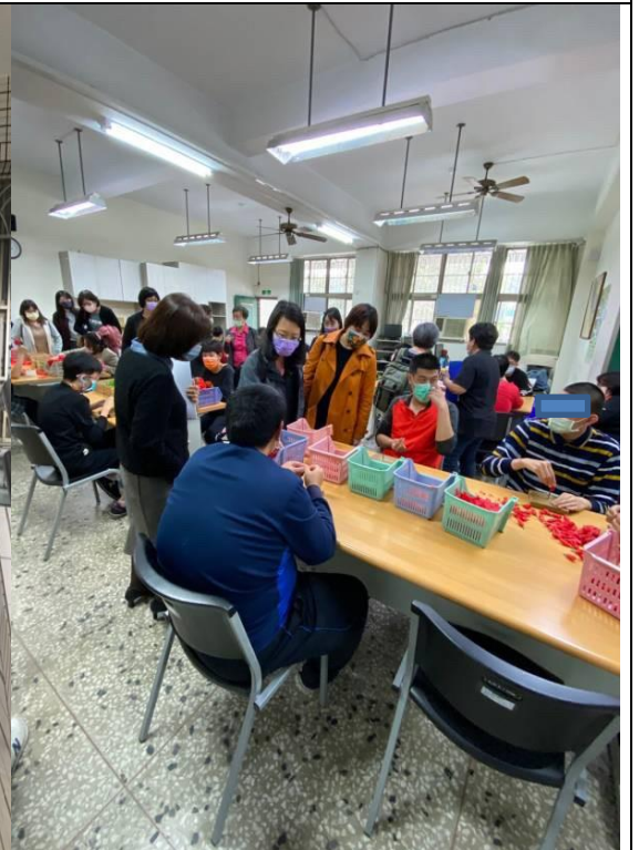
圖7：調查委員實地履勘五餅 二魚小型作業所之學員作業