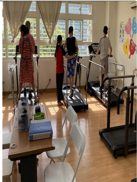
圖9：身障個案復健情形。