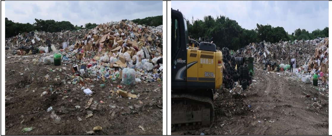
照片1 本院派員於108年9月17日履勘蘭嶼鄉垃圾衛生掩埋場之實況

(三)綜上，蘭嶼鄉公所未依照環保署94年4月19日環署廢字第0940028974號函釋妥善辦理蘭嶼鄉垃圾衛生掩埋場之垃圾分類、回收及場區環境維護等工作，致使場區有大量垃圾外曝，影響環境衛生，且任由一般垃圾中混雜巨大垃圾及資源垃圾，加重掩埋場沉重負擔，並衝擊觀光品質，顯有失當。