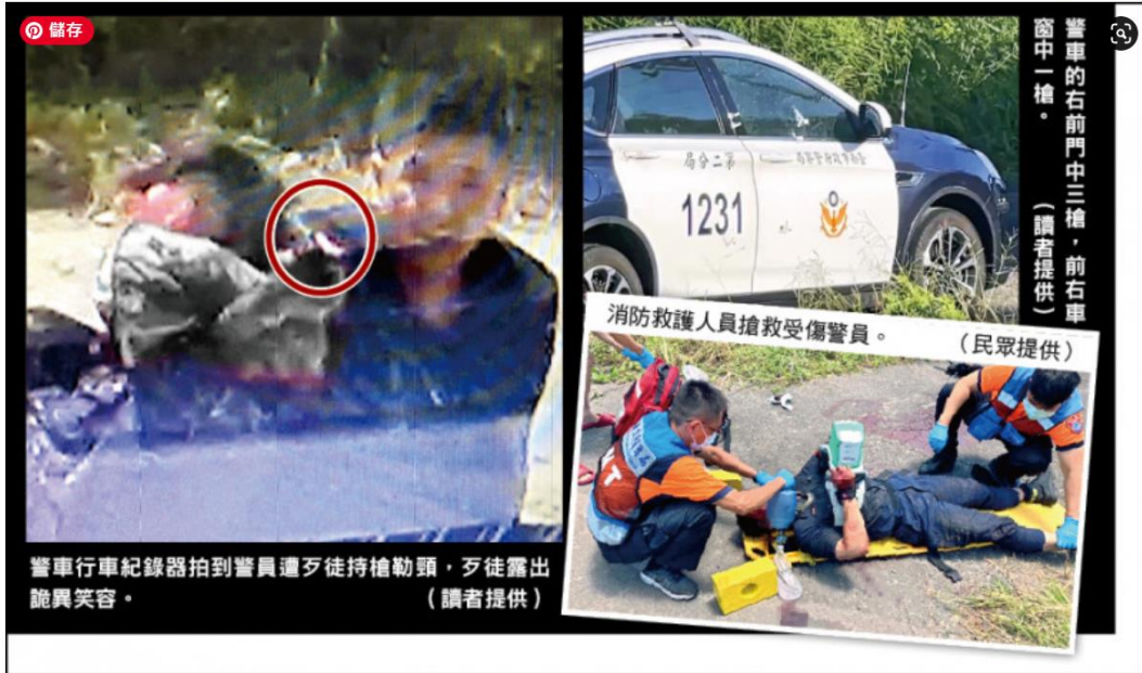
警車行車紀錄器拍到警員遭歹徒持槍勒頸，歹徒露出詭異笑容。(民眾提供) 警車的右前門中三槍，前右車窗中一槍。(民眾提供) 消防救護人員搶救受傷警員。(民眾提供)