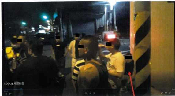
附圖一：警方盤查畫面

(1) 媒體引用標題為「屏東分局竟被黑衣人包圍」之報導，惟檢視該分局當日現場蒐證影像，員警係於分局斜對面停車場盤查相關在場民眾（如附圖一）；與媒體報導時所使用之民眾提供影片，位置相符（如附圖二），並無包圍該分局情事，顯見該媒體所用標題用詞欠妥當。