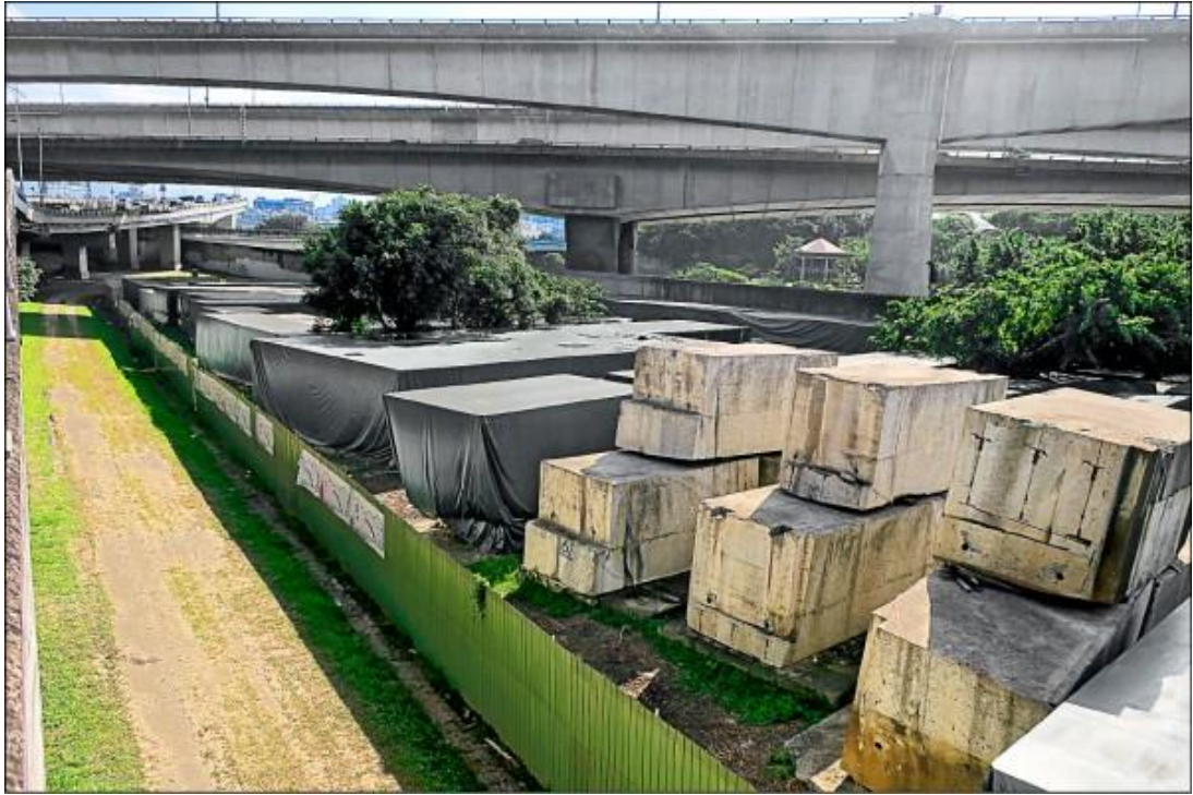
圖 3 中山橋(明治橋)被肢解成 435 塊石塊 13