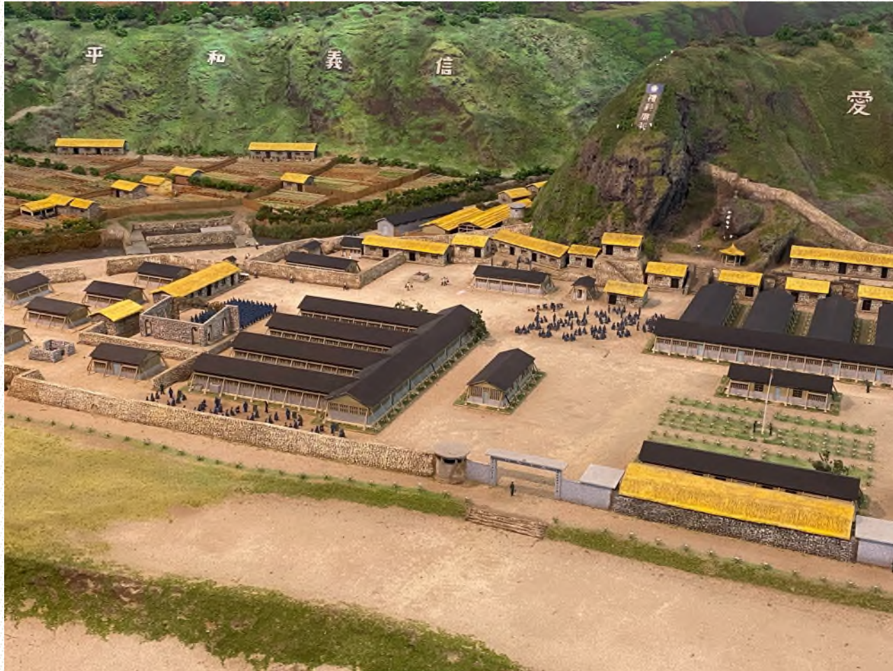
本院履勘新生訓導處現況相片