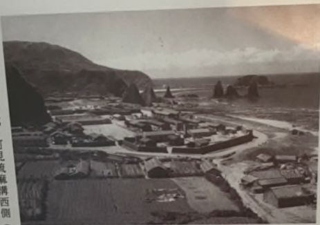
Photo taken from the east of New Life Correction Center, showing New Life Correction Center camp area (top), the farmland and settlement (bottom)

從東拍攝新生訓導處，可見流麻溝西側（圖上方）為新生訓導處營區，東側（圖下方）為菜園及民宅聚落。