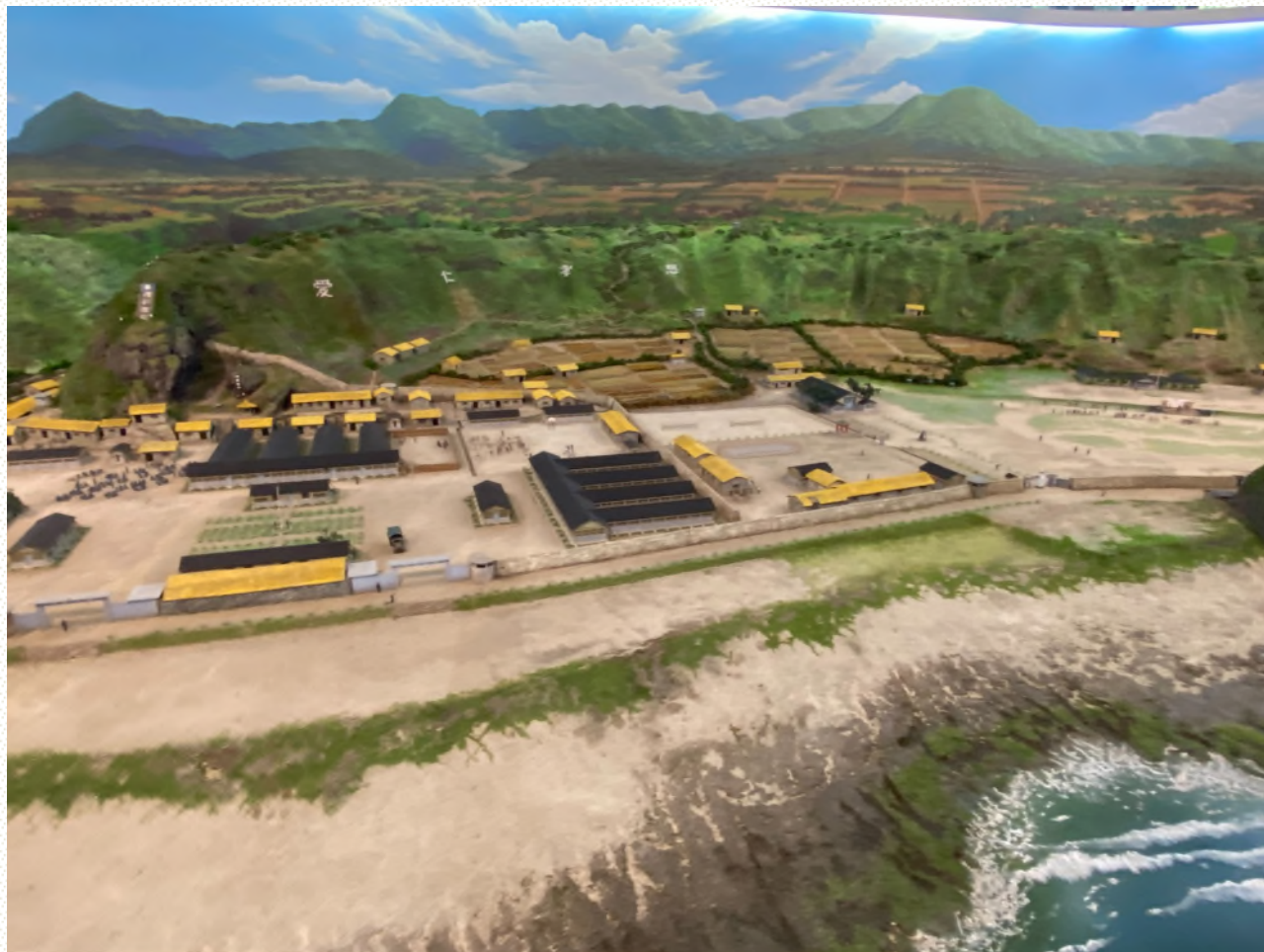
本院履勘新生訓導處現況相片