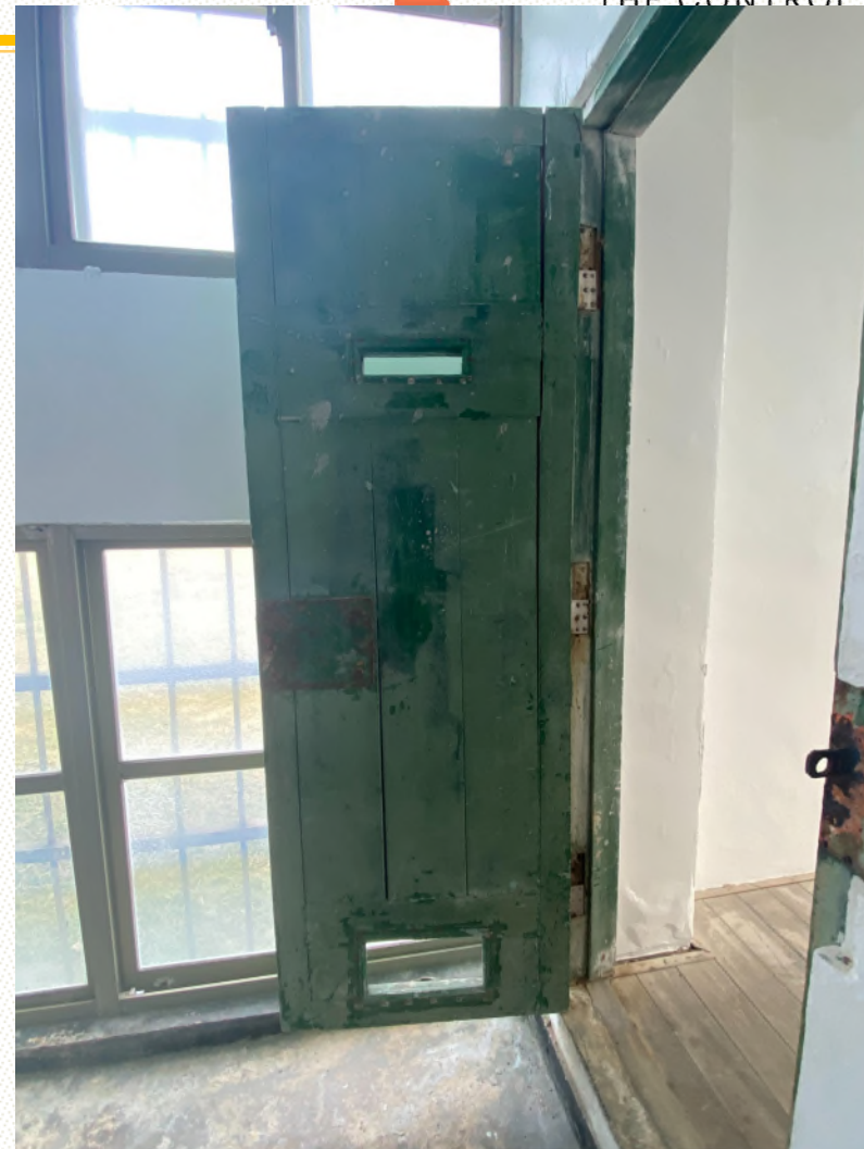
本院履勘新生訓導處現況相片