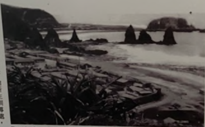
Photo taken from uphill of Liuma Ditch, showing east side of New Life Correction Center was annexed to Liuma Ditch

由流麻溝旁邊的山上往下拍新生訓導處，可見流麻溝與新生訓導處東側相照。