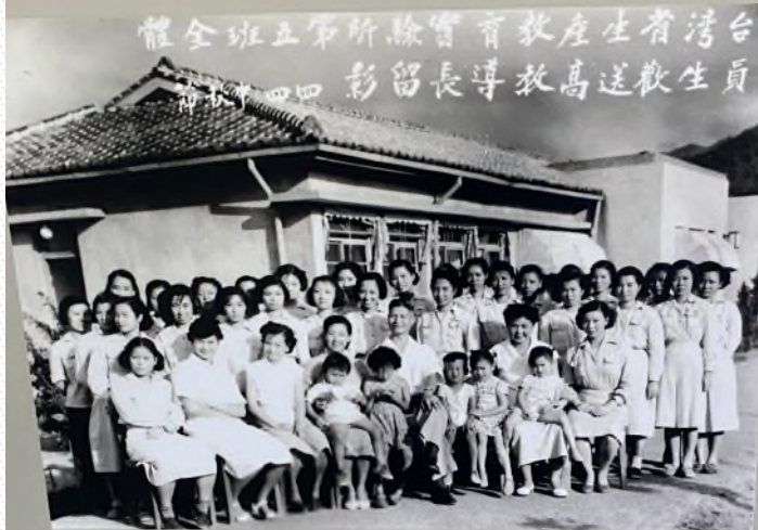
1955年中秋，台灣省生產教育實驗所第5班全體合影。受難者包括從新生訓導處送回台灣的女生分隊隊員，及隨著母親被關的小朋友。

ren later), and those who were about to complete their sentence. After 1952, despite the name was changed to "Ren Ai Education Training Center," it remained the re-education and thought reform venue for the political prisoners.