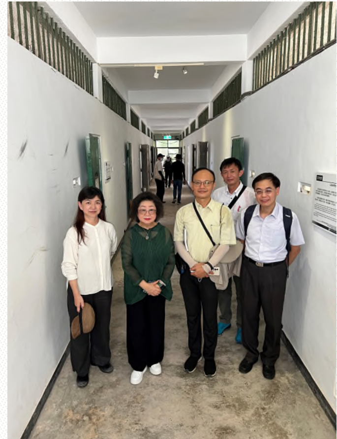
本院履勘綠洲山莊現況相片