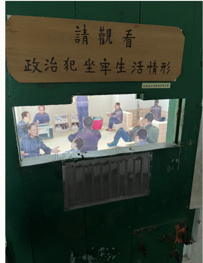
本院履勘綠洲山莊現況相片