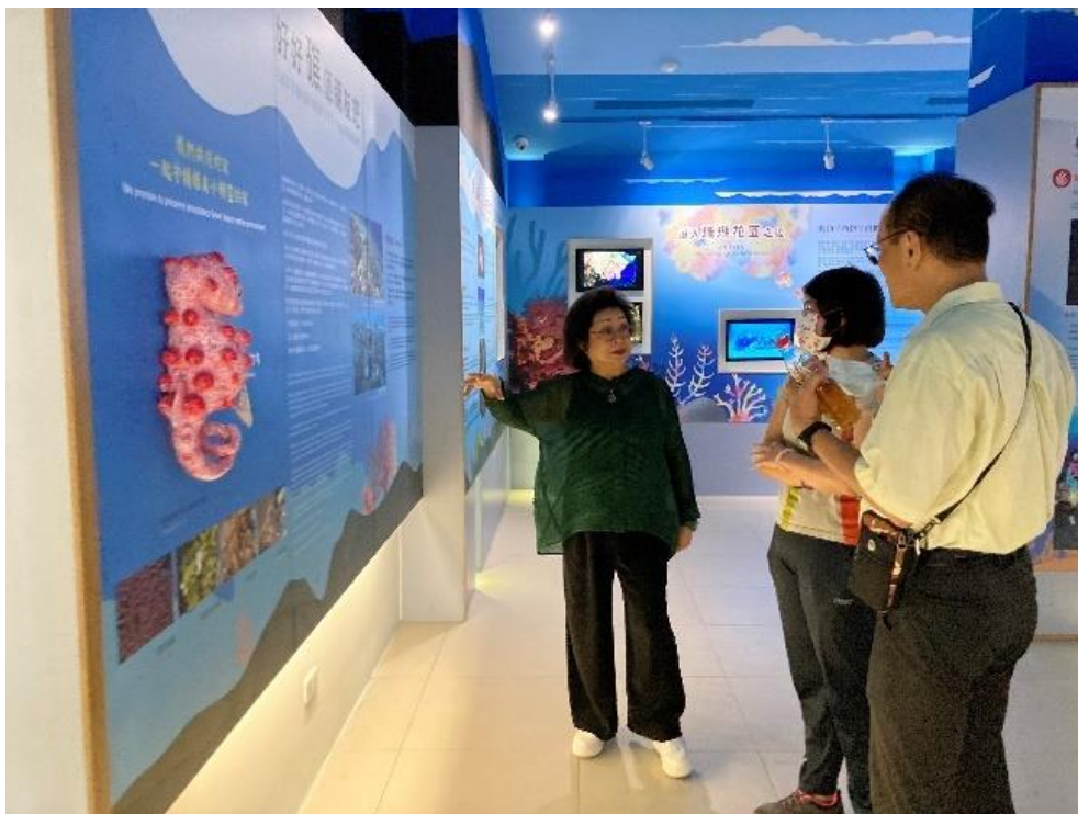
圖4 本院監察委員111年9月17日履勘綠島遊客中心