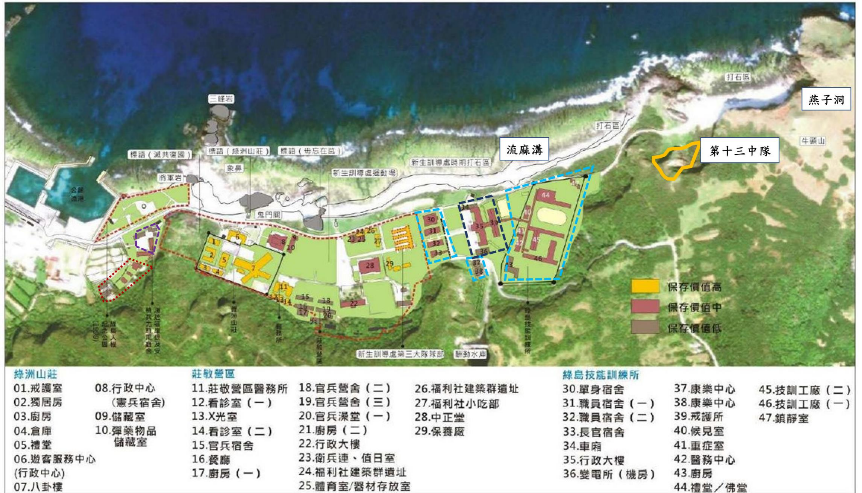
圖8 綠島人權文化園區範圍土地所有權機關示意圖

(2) 上表所列土地或建物及其所有權機關範圍示意圖、白色恐怖綠島紀念園區新生訓導處全區模型圖如下：