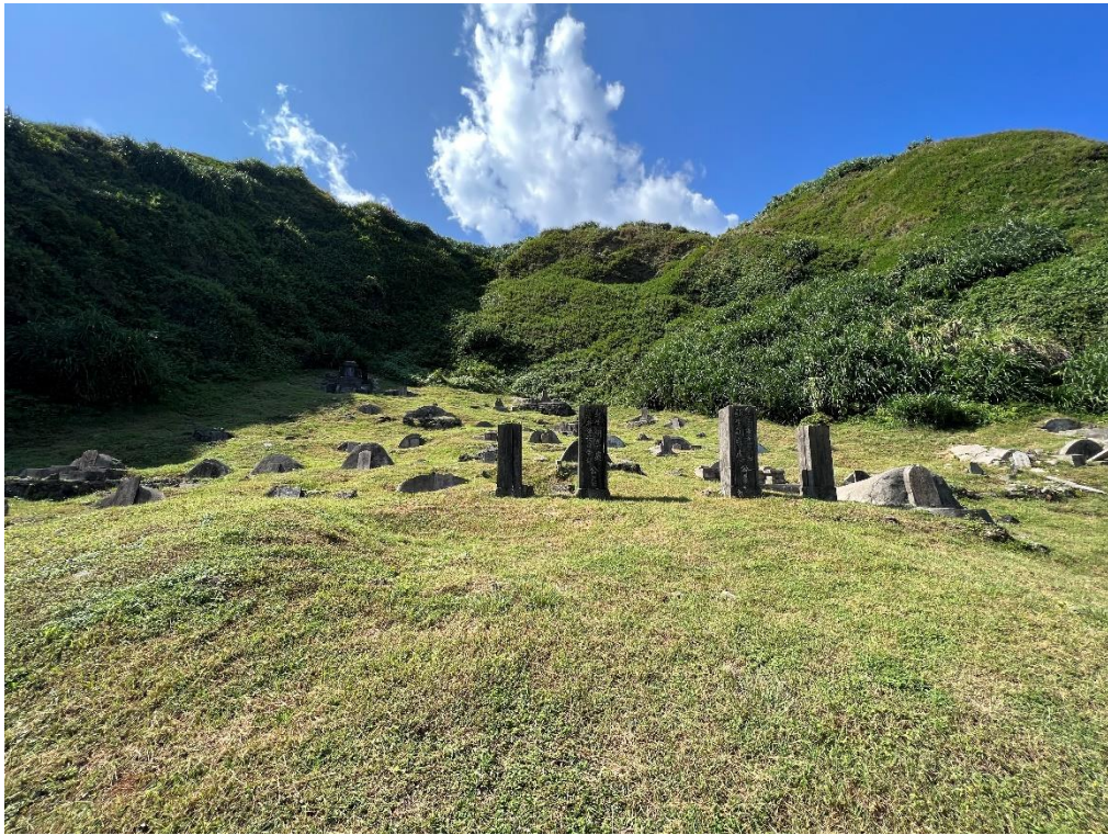
圖5 綠島人權園區綠洲山莊公墓（第十三中隊）現況相片（1）