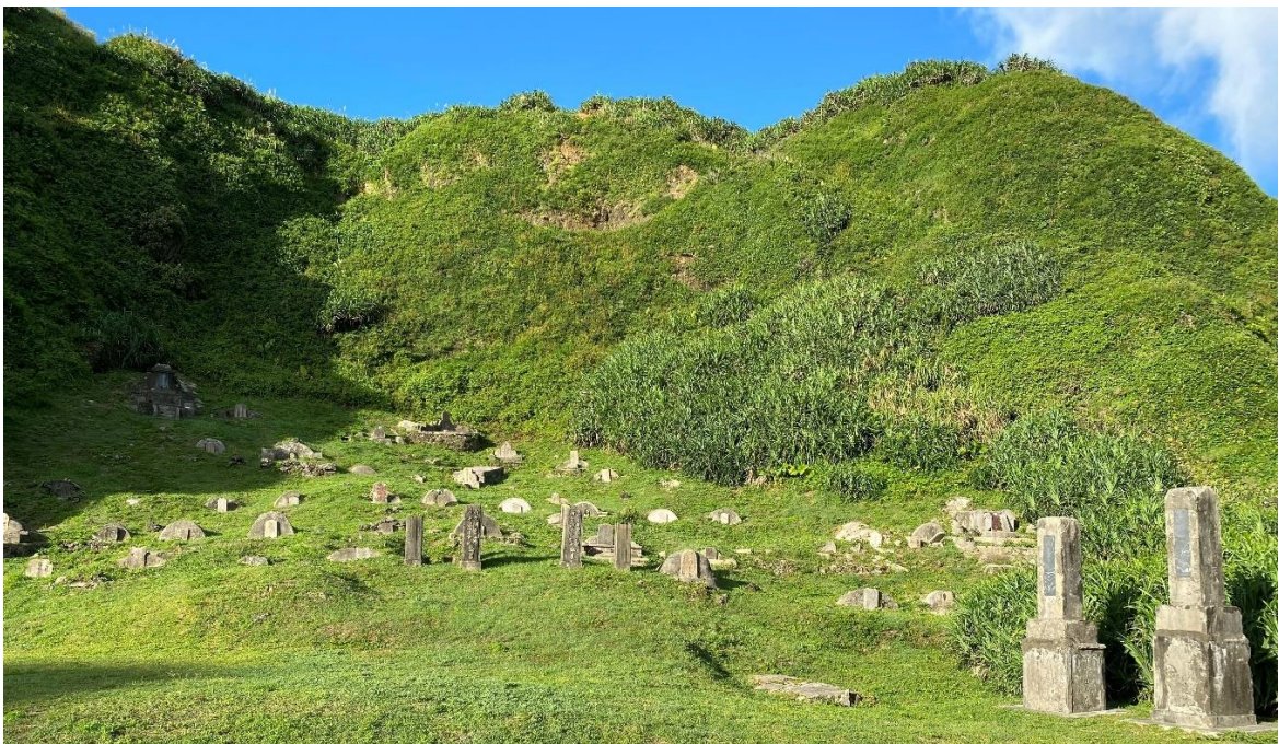
圖1 新生訓導處公墓現況照片（第十三中隊全貌） 資料來源：文化部111年8月1日文版字第1113020490號函。