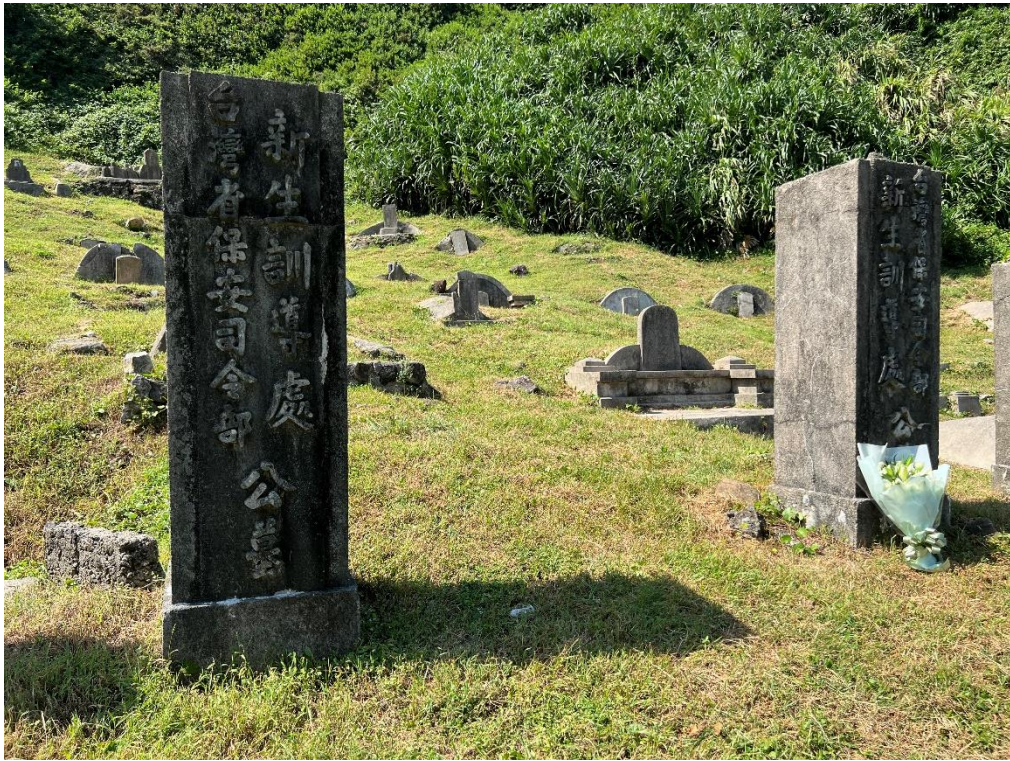
圖2 綠島人權園區綠洲山莊公墓現況相片（第十三中隊門柱）