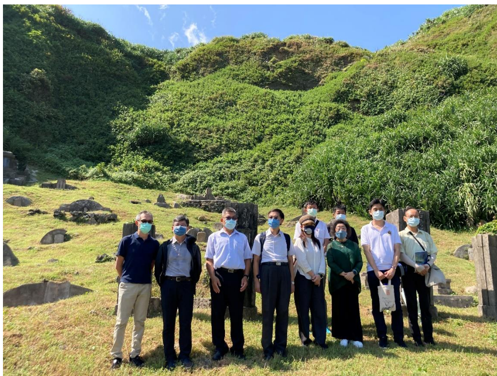
圖8 本院會同主管機關履勘綠島人權園區綠洲山莊公墓（2）