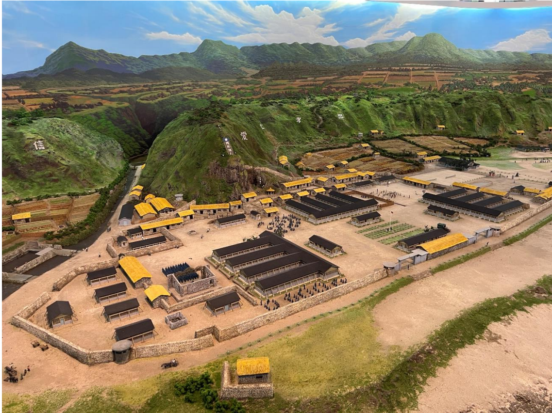
圖10 白色恐怖綠島紀念園區新生訓導處全區模型圖

(3) 有關機關或單位之相關建物、設施，利用綠島人權園區內舊有建築使用情形（原用途、現用途、使用面積）：