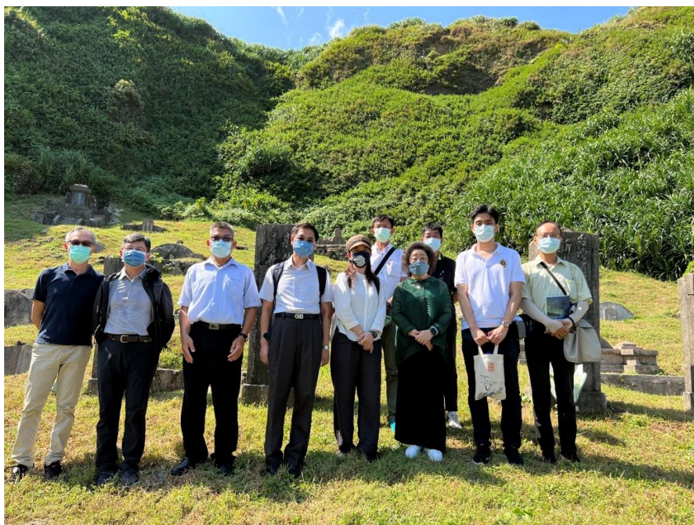
圖7 本院會同主管機關履勘綠島人權園區綠洲山莊公墓（1）