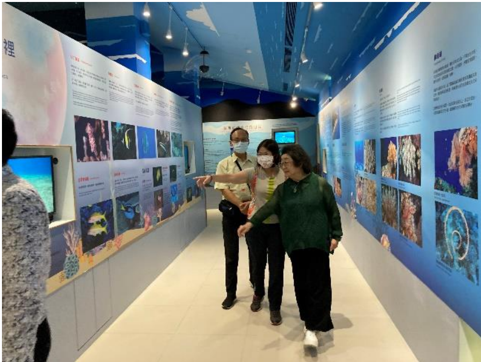
圖5 本院監察委員111年9月17日履勘綠島遊客中心展示區