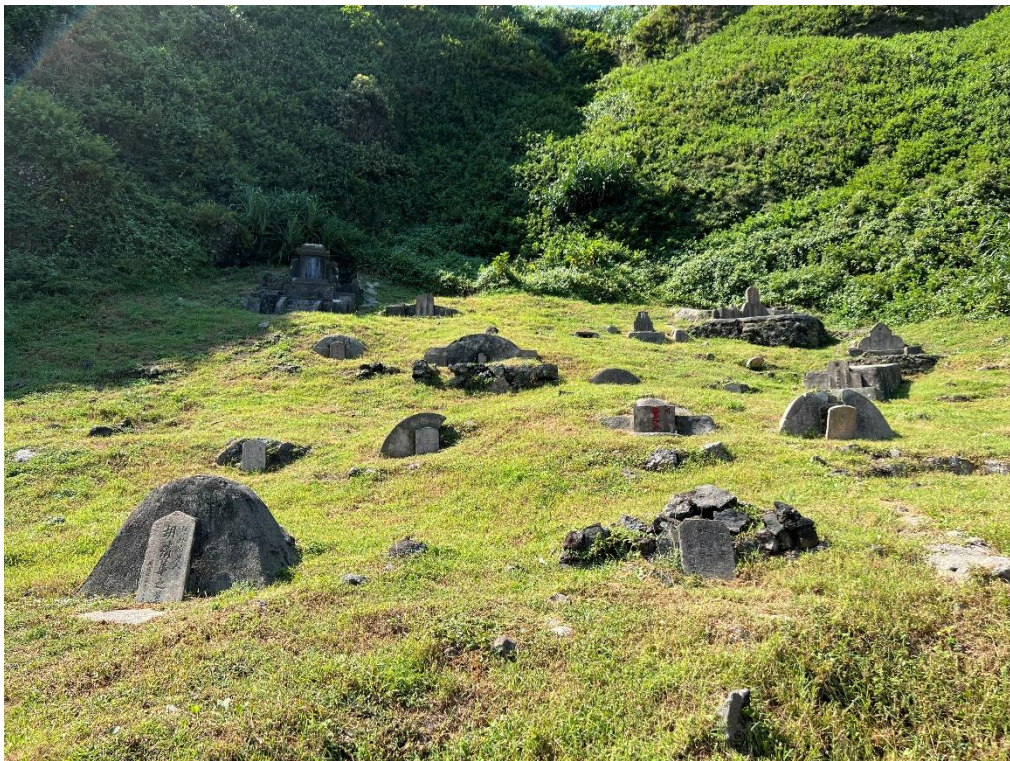
圖6 綠島人權園區綠洲山莊公墓（第十三中隊）現況相片（2）