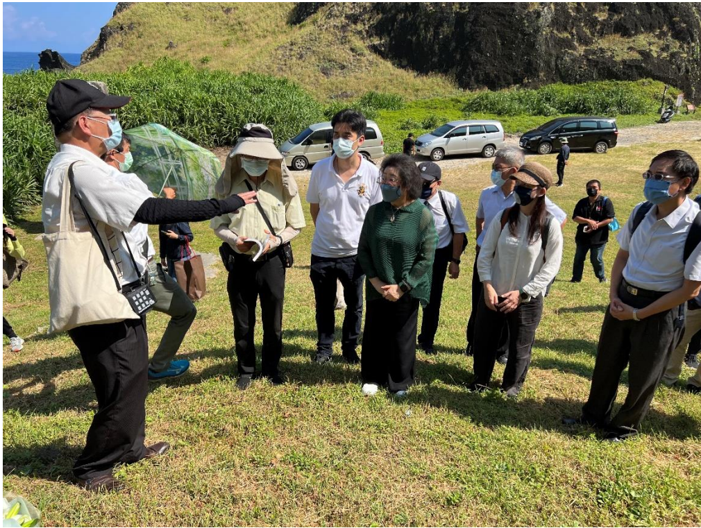
圖9 本院會同主管機關履勘綠島人權園區綠洲山莊公墓（3）