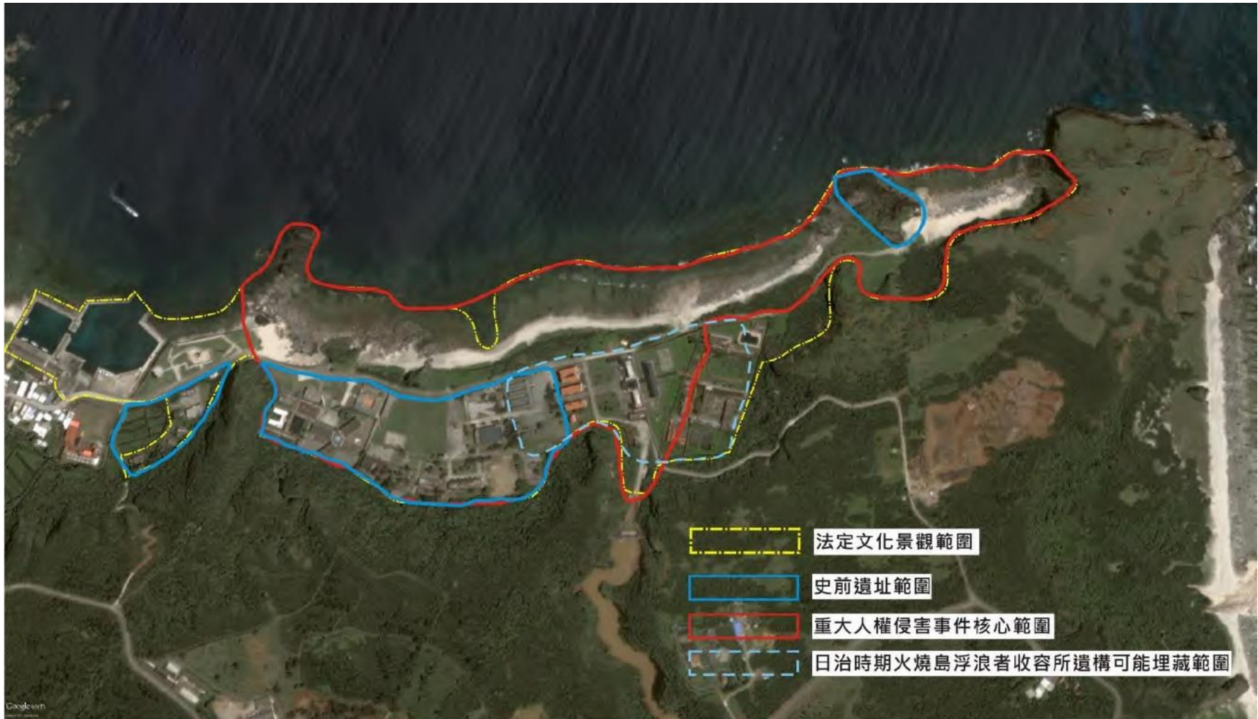
圖6 綠島人權文化園區文化景觀高強度核心地景範圍圖 資料來源：文化部111年8月1日文版字第1113020490號函。