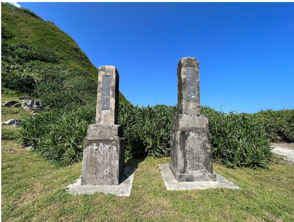
圖2 綠島人權園區綠洲山莊公墓相片（第十三中隊時任處長、副處長紀念碑）