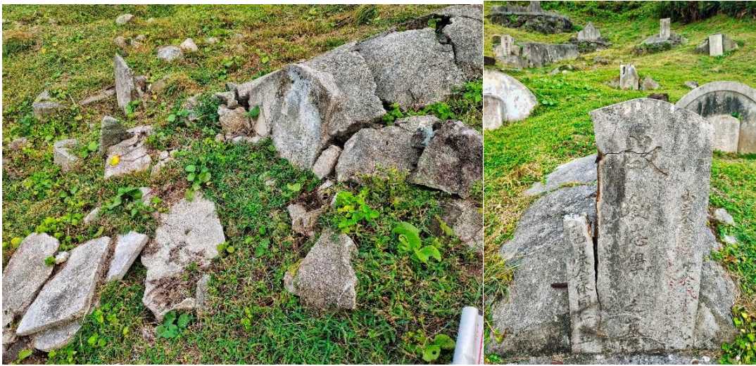
圖3 新生訓導處公墓（第十三中隊）許多墳墓破敗景象