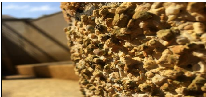
圖2 大眾池支柱經冷泉侵蝕後照片

7月11日至10月31日免費對外開放試營運期間，即因浸泡冷泉水之大眾池四周（包括兒童池、戲水池A、B、泡水池）、親水階梯、池內水椅、支柱，及泡水池水中迴廊池底等，係採用細小石子之洗石子或抵石子工法施工，經冷泉水浸泡後產生化學反應致表面水泥剝落，小石子突出產生銳角割傷遊客（詳圖2、3），以致試營運期滿後，自108年11月1日起停止對外開放，迄110年3月底止仍無法正式營運，衍生拆除已施作設施及增耗改善支出。