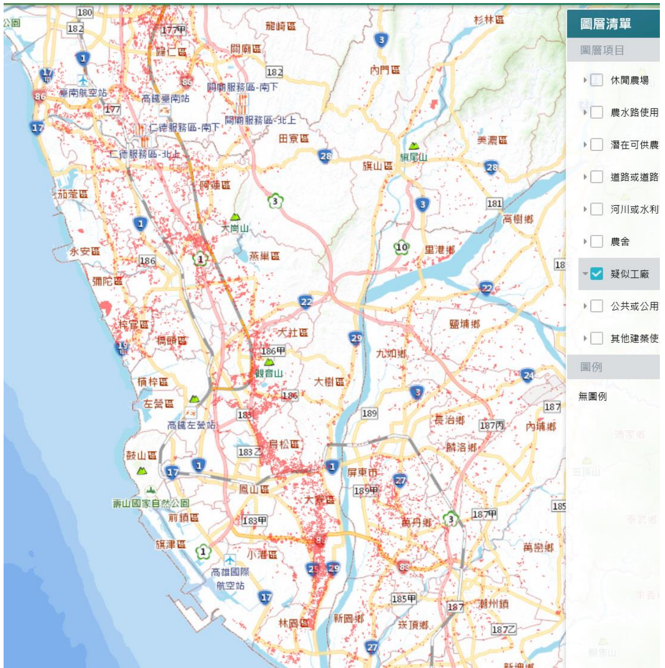
截自農委會「農業及農地資源盤查結果查詢圖台」 -高雄市、臺南市及屏東縣範圍(110年10月18日) 註：紅色標示即為「疑似工廠」。