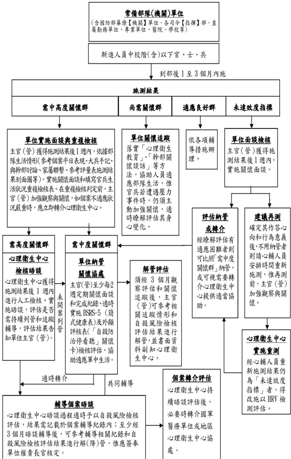
圖2 「國軍身心狀況評量表(志願役版)」施測結果處遇流程