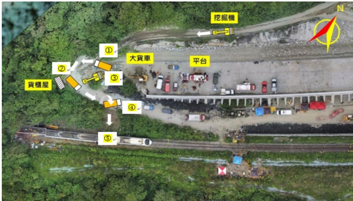
圖1 大貨車移動及挖掘機停放位置

(五)查K51標工程工地管理，施工廠商東○公司於工地出入口雖設有大門，但門鎖早已於110年元旦故障，以麻繩捆綁代替；白天施工期間東○公司有請1個守衛在門口看守，但沒有要求守衛確認施工人員的工作證，平時守衛大概從一早工作到下午5點多才離開，110年4月2日事故發生當天守衛並不在現場。嗣經檢察官現場勘查，發現大門管理鬆散，沒有鑰匙上鎖也沒有監視器，監造廠商未依規定監督施工廠商改善門禁管制設施，在工地大門幾近毫無管制之情況下，長達4天之清明節連假期間任憑外界人士隨意進出，為此次事故早已埋下伏筆。本次事故據運安會重大運輸事故調查報告表示：「東○公司提供之施工計畫及聯○○○公司提送之監造計畫，皆無門禁及時間管制等相關資料。於施工日誌、監造日誌中亦無相關資料可稽。於東○公司提送之職業安全衛生計畫書中亦未有門禁工程施工計畫及門禁管理計畫等相關資料。臺鐵局工務處109年3月13日、9