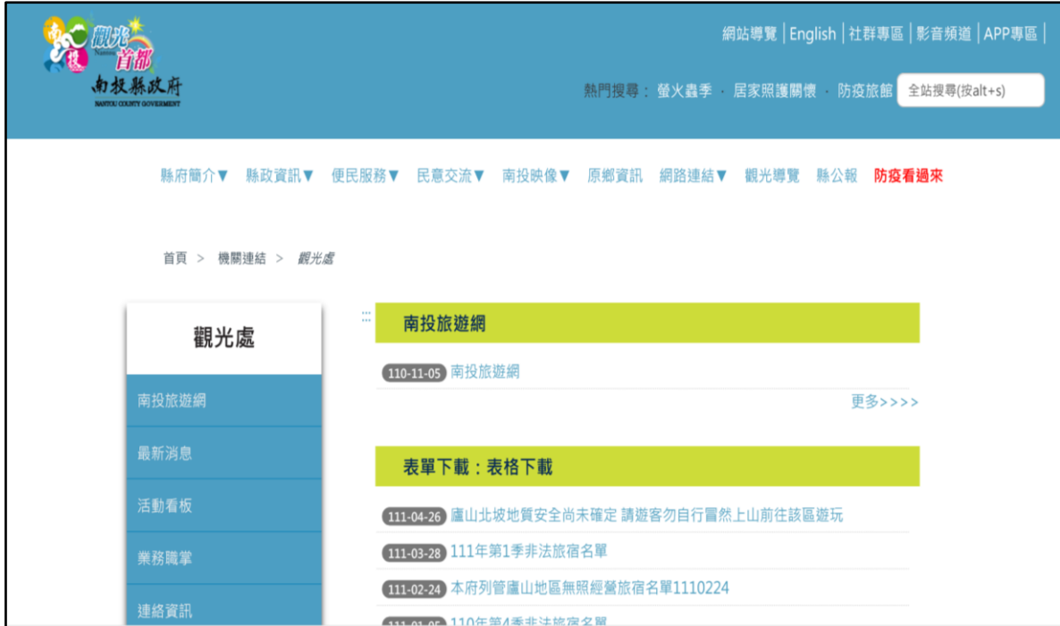
附圖 3、南投縣政府於 111 年 4 月 26 日在該府網站公告之警 示