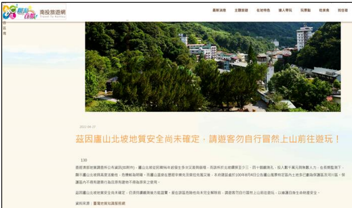
附圖 4、南投縣政府於 111 年 4 月 27 日在南投旅遊網公告之警 示