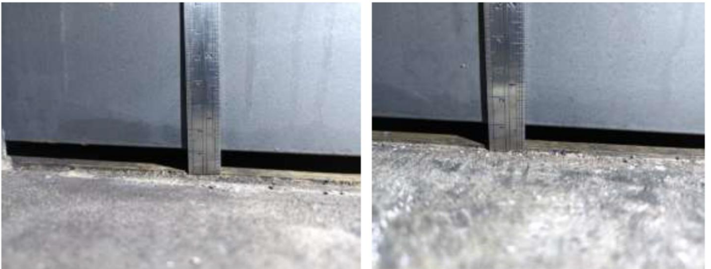
圖5 本事件殉職消防員所在房間管道間及天花板間隙佐證照片