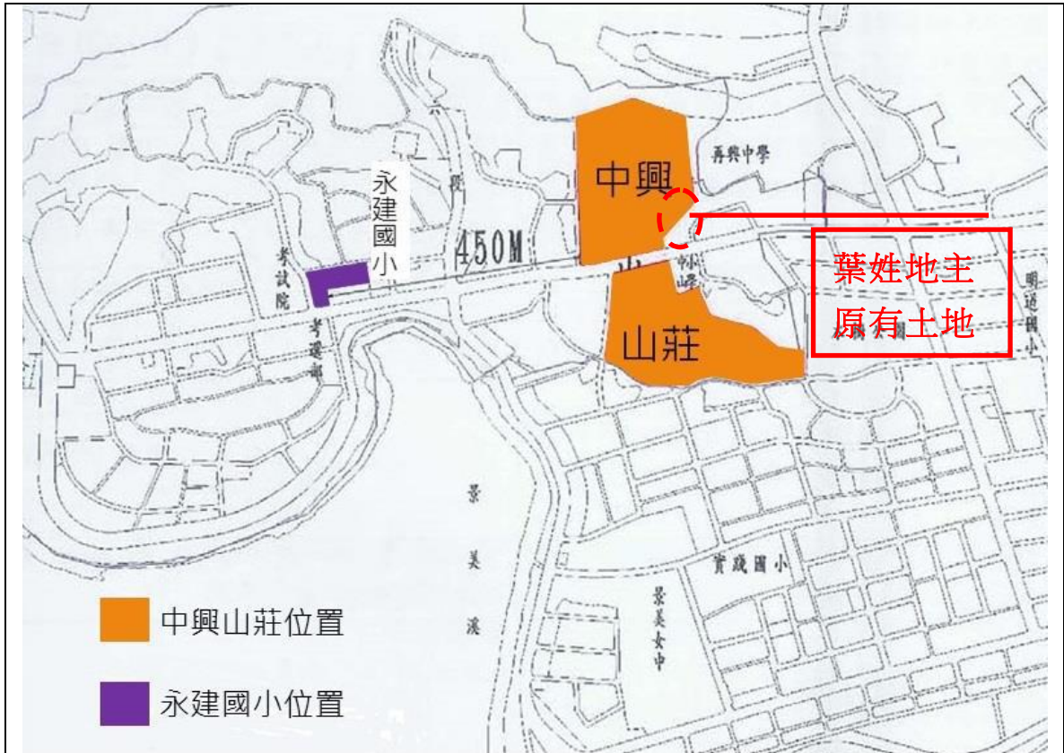
圖1、永建國小原址與中興山莊相對位置示意圖