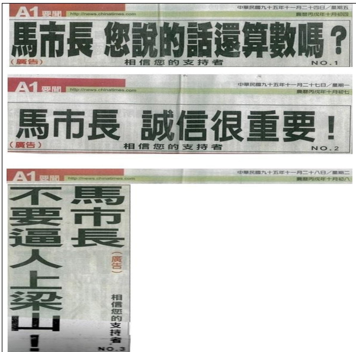
圖3、95年11月24日、27日及28日中國時報頭版廣告內容截圖

立專案小組(下稱市都委會中興山莊專案小組)，並分別於94年8月22日、94年11月2日、95年10月12日、95年11月13日召開4次專案小組會議，惟中興山莊都市計畫案之主要計畫仍未審議通過。95年11月24日、27日及28日，元利建設之關係企業即全聯實業股份有限公司，突於中國時報連續3日頭版，刊登系列廣告直接向時任臺北市市長馬英九喊話，刊登內容如下：