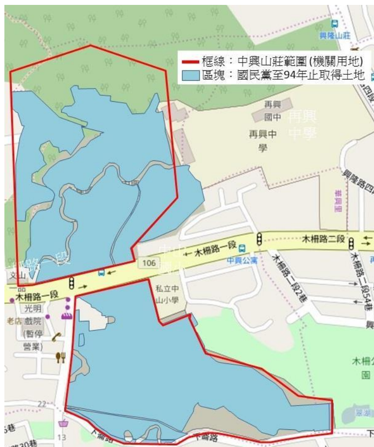
圖1 中興山莊範圍及國民黨名下土地範圍示意圖

(三)經查本件陳訴人及陳訴之標的雖與本院上開108內調0119調查案相同，惟其陳訴意旨及內容與該調查案顯不相同，並無本院立案派查原則第4條第2款「屬同一案件應併案處理者」之情事，且具有深入瞭解之必要，爰另立本案調查。