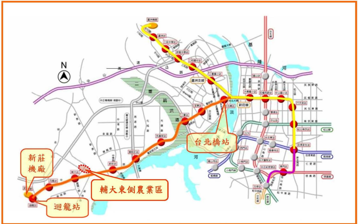
圖 1 新莊機廠原規劃工址輔仁大學東側農業區及現今坐落位置比較圖

進行協調。行政院於同年 9 月 17 日同意新莊線及蘆洲支線規劃報告書，新莊機廠確定設於樂生療養院址，然而就此衍發後續樂生療養院院區保存事件。