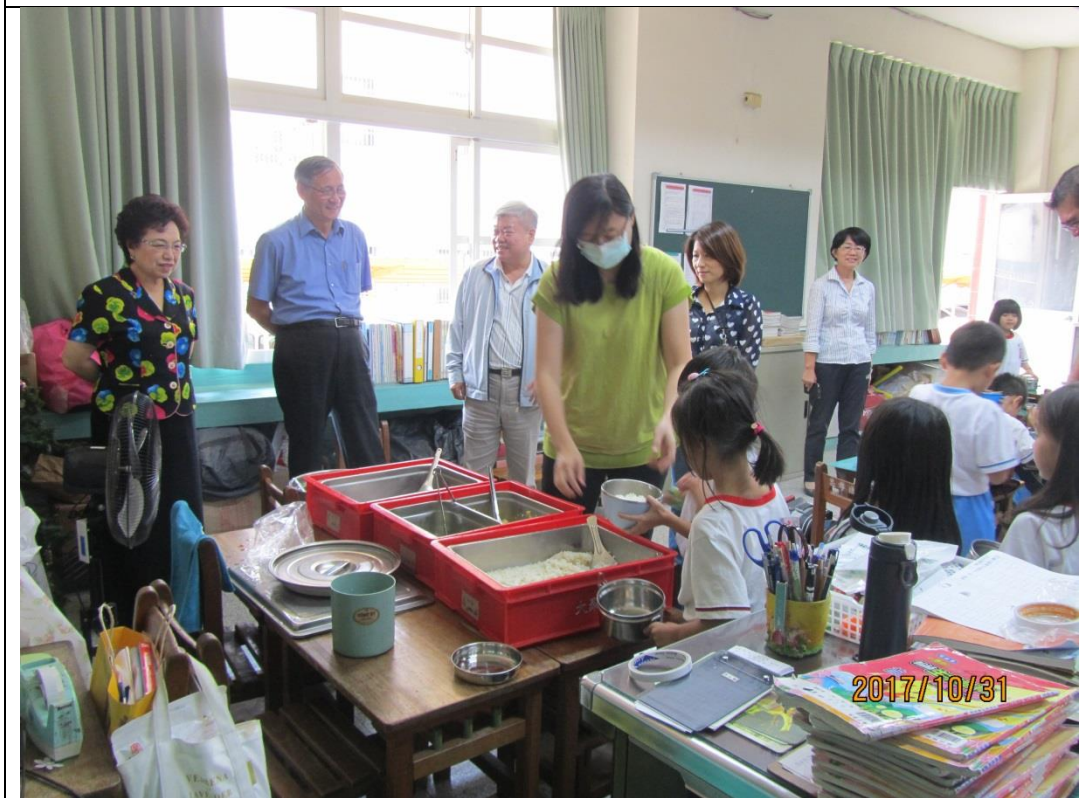
訪視屏東縣忠孝國小營養午餐現場