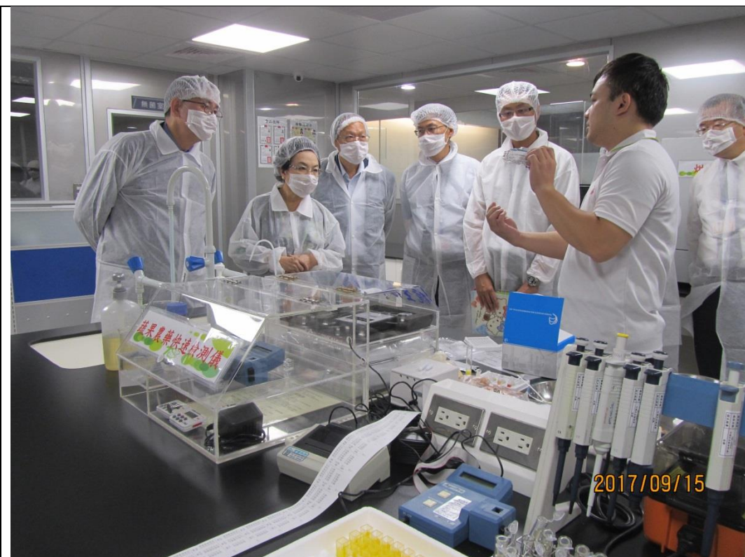
參觀新北市團膳業者廚房現場(解說農藥檢測項目)