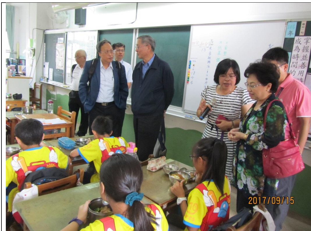
訪視新北市昌平國小營養午餐現場