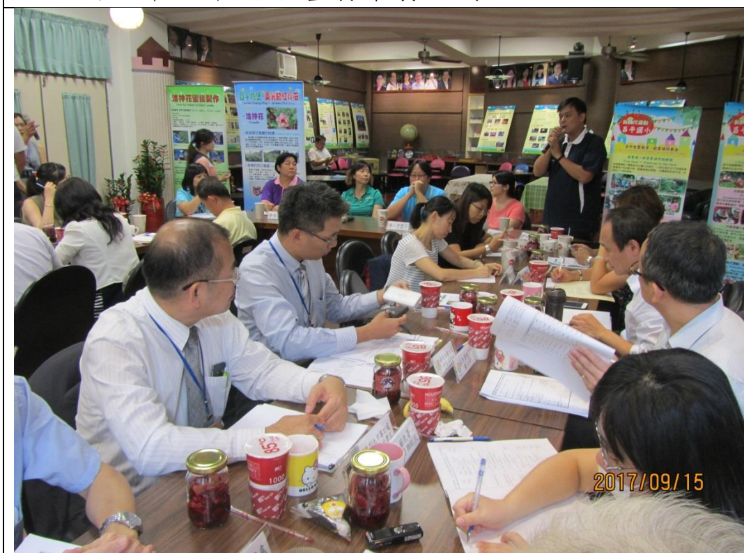
新北市座談會聽取意見（昌平國小）