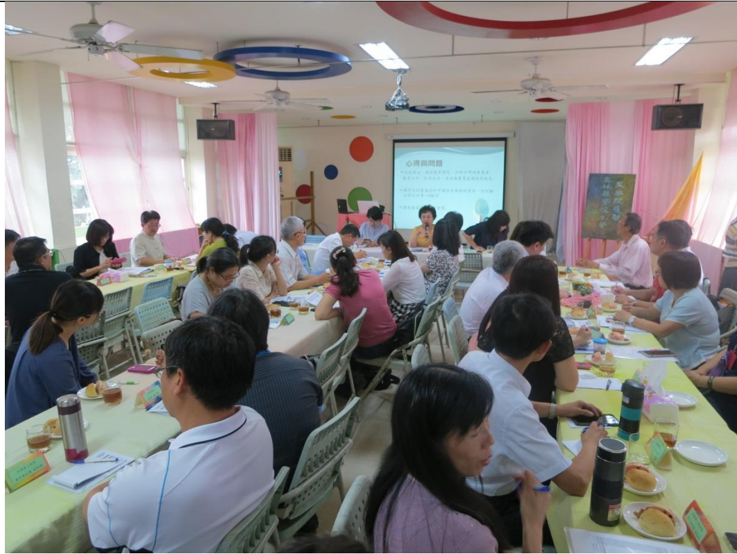
雲林縣座談會聽取意見（華德福實驗小學）