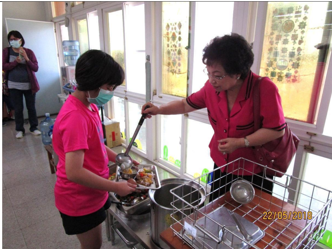
訪視澎湖縣文光國小營養午餐現場