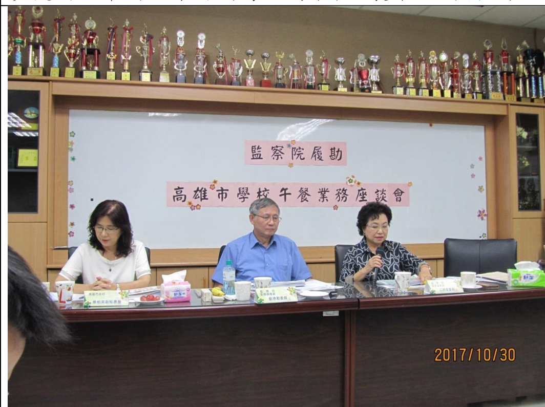
高雄市座談會聽取意見(福山國小)