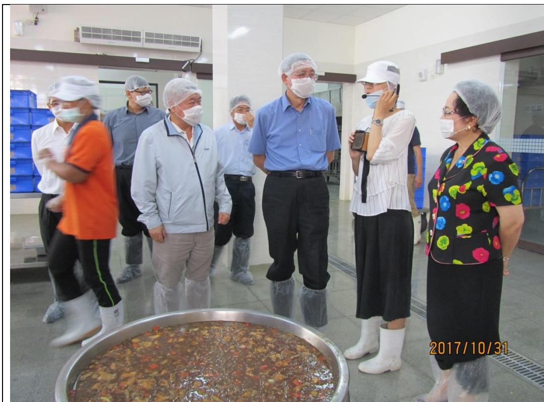
參觀屏東縣忠孝國小中央廚房現場