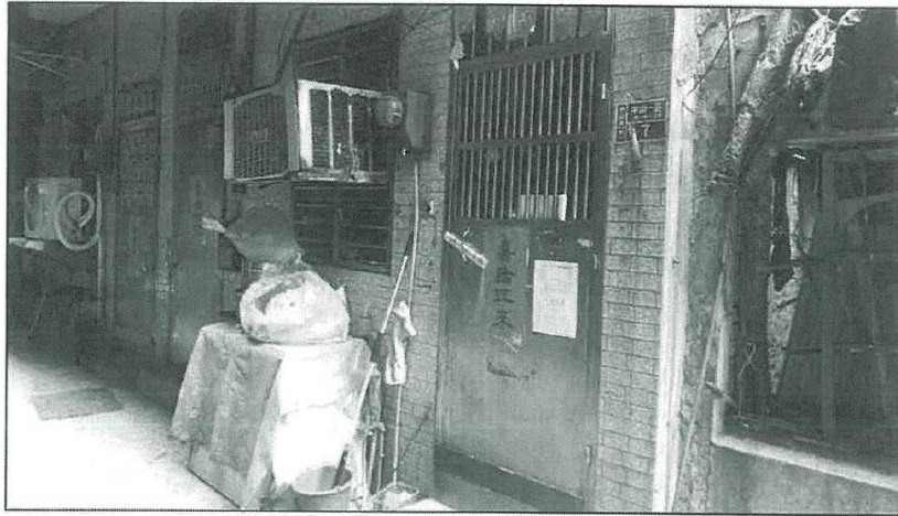
照片3 宜蘭分署 107 年 4 月 27 日查封陳姓義務人不動產現場照片