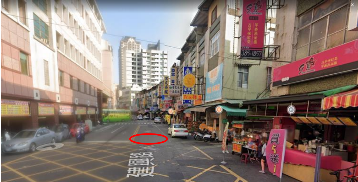
圖2 事故地點之Google街景 (紅圈為機車及行人倒地處，左側建築為樹德家商)

3、未標示事故地點旁為學校及減速慢行之標線：按道路交通安全規則第93條第2款規定：「車輛行經設有……學校……標誌之路段……均應減速慢行，作隨時停車之準備。」，道路交通標誌標線號誌設置規則第163條規定：「『慢』字，用以警告車輛駕駛人前面路況變遷，應減速慢行。」，經查，建興路快車道之行車速限雖為50公里（參照道路交通安全規則第93條第1項第1款），但案發地點旁為高雄市立樹德家商，前方建興路與141巷口交叉之車道上劃設「慢」字之標線，警告車輛行至該路段時應減速慢行，作隨時停車之準備。惟該現場圖未標示該路段位於學校周邊及減速慢行之標線，卻註明肇事地點無號誌，顯有疏漏。