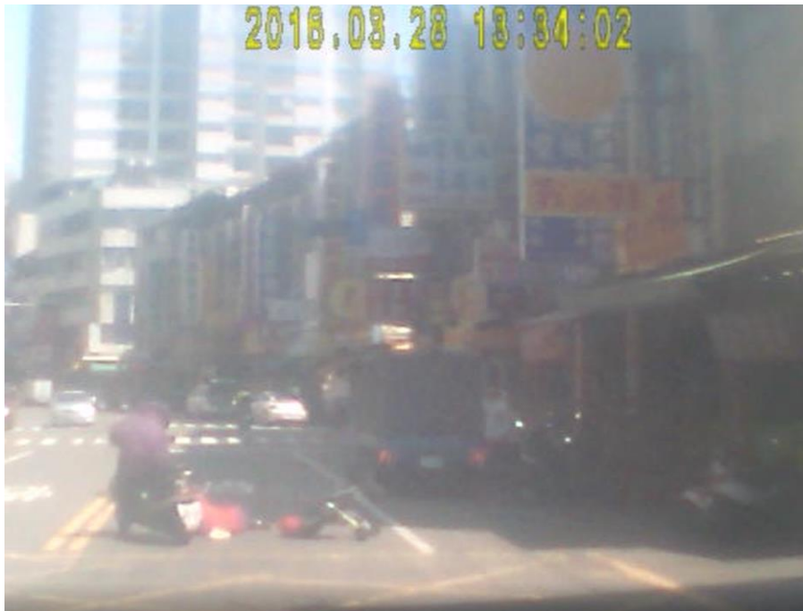
圖3 他車行車紀錄影像截圖