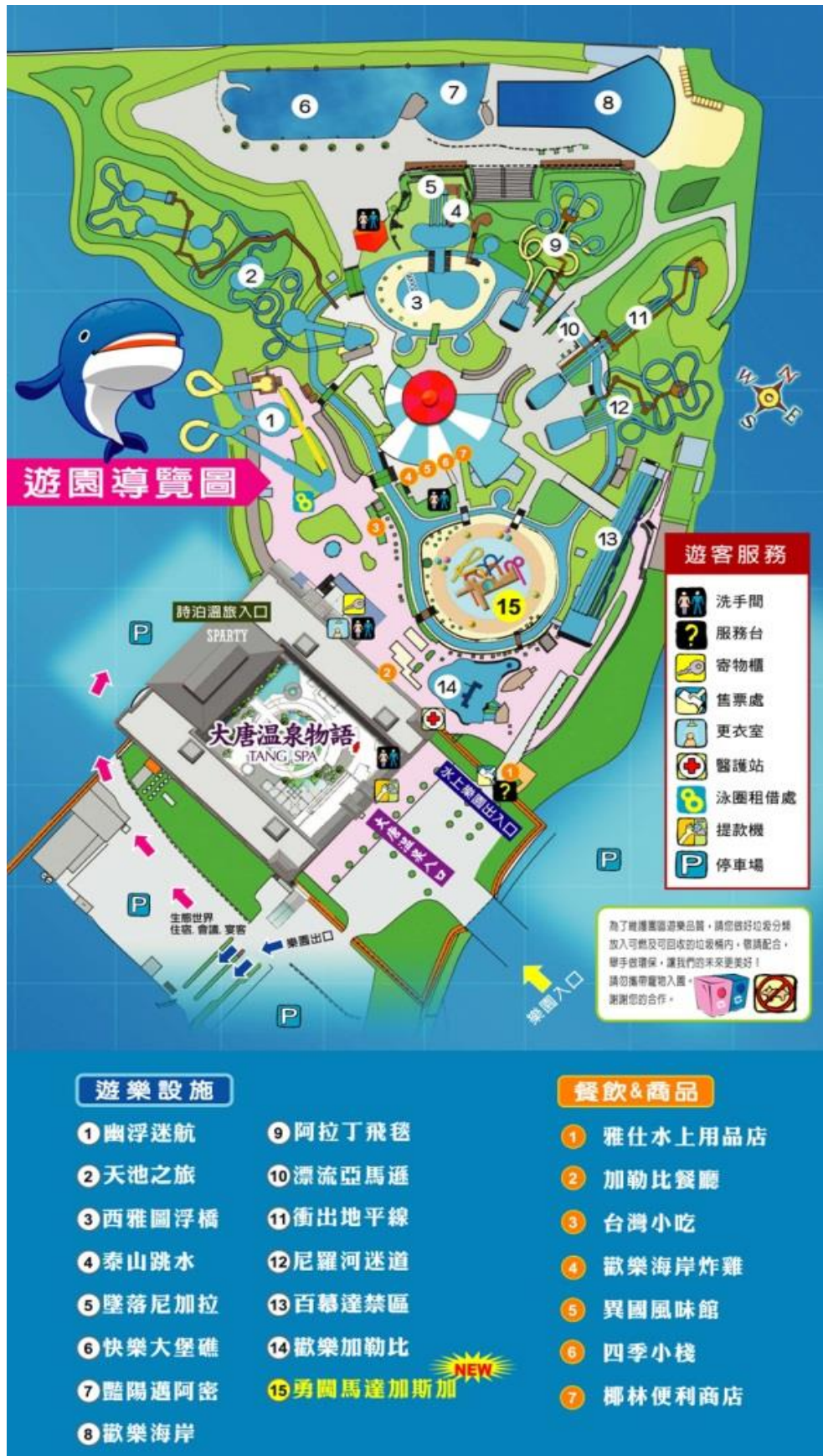
附圖 2、八仙水上樂園導覽圖